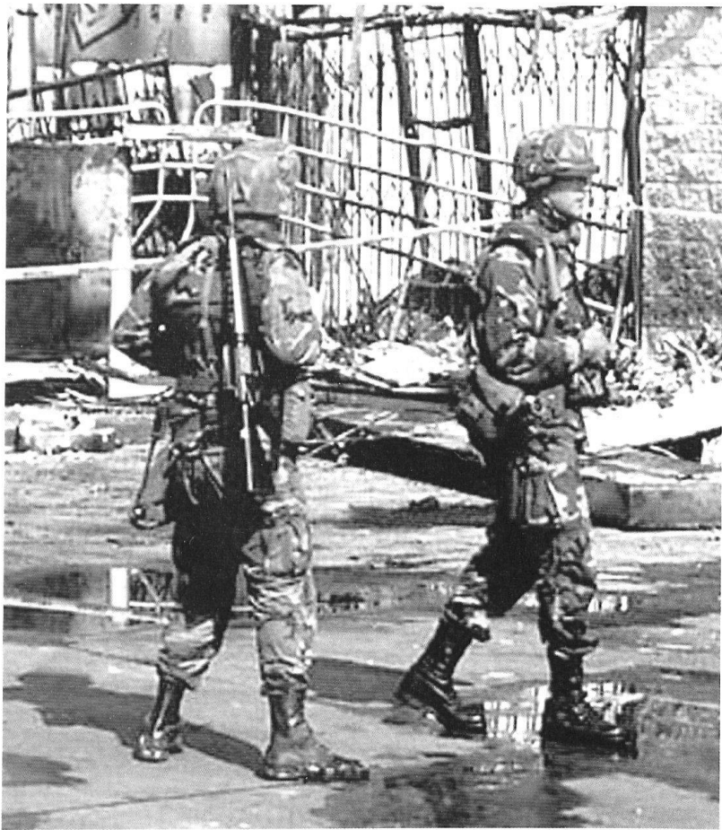
Patrouille de la Garde nationale à Los Angeles.

Les réserves britanniques, composées exclusivement de volontaires, ont joué un rôle important pendant le conflit du Golfe. 1774 réservistes se sont alors joints aux forces britanniques régulières. 50% s'étaient engagés à titre individuel, l'autre moitié venant, pour l'essentiel (552 volontaires), de la Territorial Army . Si l'on inclut les réservistes rappelés, le total des réservistes ayant participé aux opérations du Golfe s'est élevé à 2000 hommes. Certains ont servi dans des unités de première ligne.