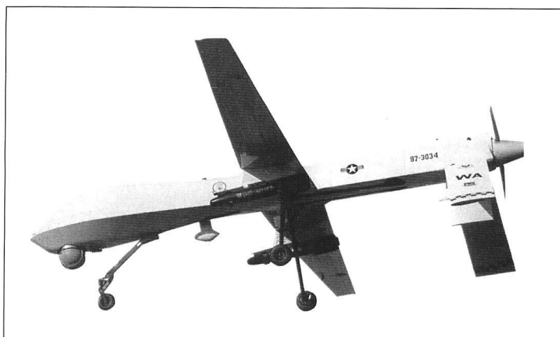
Une version du Predator armée de missiles Hellfire a été utilisée pour la première fois en 2002.

Ces trois missions se révèlent incompressibles. Même s'il est techniquement possible de remplacer un chargeur humain par un système entièrement automatique, supprimer le pointeur pose un dilemme insoluble. Si le commandant doit pointer, il perdra la vue d'ensemble – qui est sa mis-