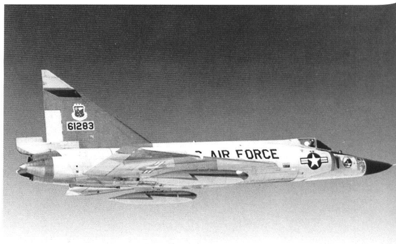
Le chasseur américain F-102 Delta Dart, conçu pour opérer au sein d'un réseau de défense complexe et largement automatisé.

L'enjeu est tel que d'énormes efforts sont déployés pour éliminer l'interprétation et l'erreur humaines. Ainsi, les chasseurs supersoniques des années 1960 doivent être pilotés à distance depuis un centre de commandement au sol. Ils sont amenés jusqu'à leur zone d'interception, où le radar commence sa recherche. Celui-ci