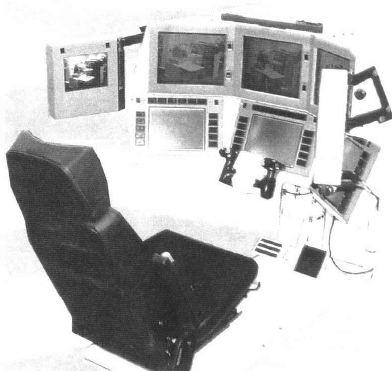
Projet de place de travail modulable, destiné au char à deux hommes (Ve-tronics).

Quant au pointage automatisé, il améliore certes la vitesse de destruction des buts et la capacité de toucher du premier coup. En revanche, il n'est pas assez «intelligent» ou auto-