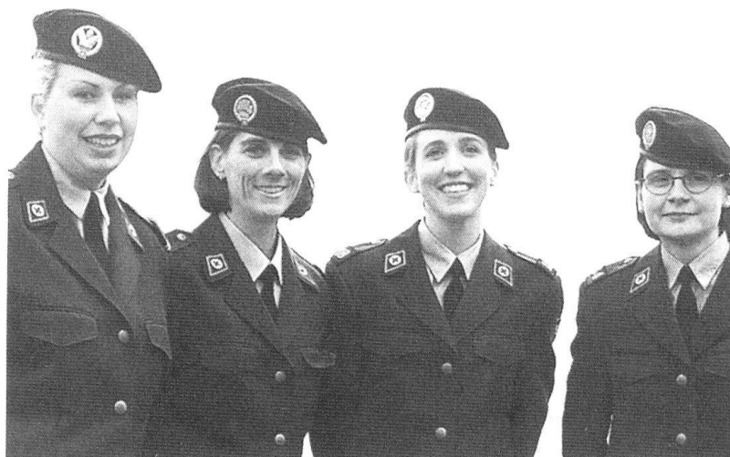
Des volontaires du SCR.

1903.- L'expérience a montré que la Croix-Rouge, la Confédération et l'armée ont besoin les unes des autres. C'est la raison pour laquelle, dès 1903, la Confédération subventionne la formation en matière de soins. Les contributions fédérales sont versées à la Croix-Rouge, qui est chargée de les transmettre aux écoles de formation reconnues par la Confédération. En échange, la Croix-Rouge devrait mettre, en cas de mobilisation, les deux tiers de son personnel sanitaire à la disposi-