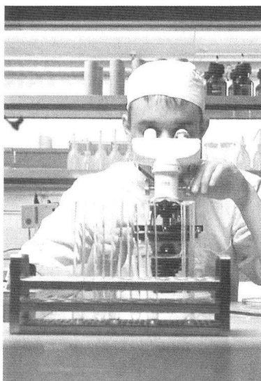
...ou au laboratoire.

Elles travaillent dans les divisions de soins, les services de réanimation, les salles d'opération, les services d'urgence, d'anesthésie, dans les laboratoires d'hôpital, en radiologie et dans les pharmacies d'hôpital. Les pharmaciennes ont la