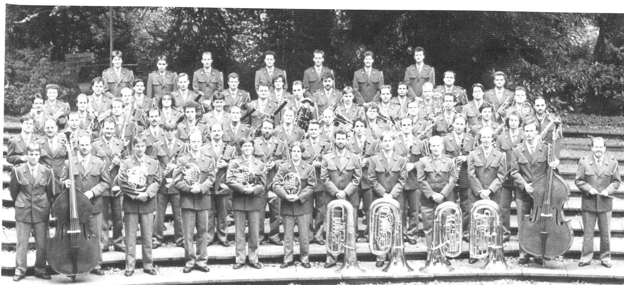
Les musiciens de l'Ensemble de cuivres de la fanfare de l'Armée.

basson des Russes et le flageolet des Turcs firent leur apparition dans les musiques militaires. La première institution régulière d'orchestres militaires dans les régiments des Gardes suisses et françaises date de 1762 et la Musique du régiment de Genève de 1783.