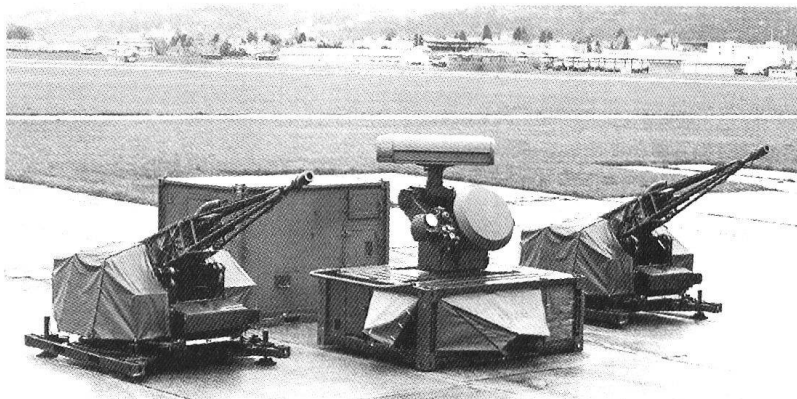
Le Skyshield 35.

La Neue Zürcher Zeitung du 23 janvier 2002 a publié un article sous la plume du colonel EMG Bruno Lezzi, rédacteur de ce journal, intitulé «Protéger les centrales nucléaires contre des attaques terroristes. Développement d'un système d'arme automatique de DCA». Il y était question du système Skyshield 35 mis au point par l'entreprise Oerlikon-Contraves, à Zurich, système auquel s'intéressent aussi bien les Etats-Unis que l'Allemagne. Il s'agit de canons de haute précision à tir rapide de 35 mm; chaque tube tire 16 grenades explosives par seconde. Deux canons avec direction des feux basée sur radar, télévision/infrarouge et laser atteignent ainsi une cadence de 2000 coups par minute. Ce système ne nécessite pas de servants sur place, il peut (mais ce n'est pas obligatoire) être télécomman-