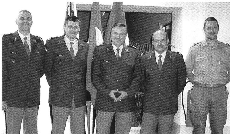
Collaborateurs de projet motivés avec le commandant du Centre d'instruction de l'armée (Lucerne).

Après une instruction de base de 7 semaines et une école d'aspirants dans les formations d'application de l'armée, les futurs officiers des Forces terrestres et des Forces aériennes accompliront un stage de formation d'officiers (SF of) de 4 semaines au Centre d'instruction de l'armée à Berne. Ensuite, les candidats suivront l'école d'officiers dans les centres de formation de l'armée. Les priorités du stage de formation des officiers sont l'acquisition des compétences dans le domaine du commandement, du social et de la technique ainsi que