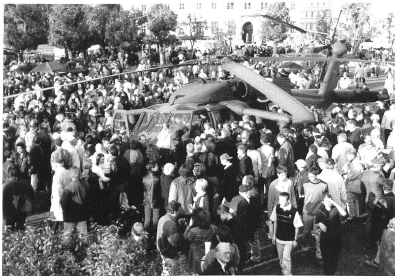
Plus l'individu a d'informations sur un objet donné, mieux il pourra se former une image. Ceci est également valable pour les forces armées.

Cette réflexion se fonde sur un processus tout à fait normal dans le choix de la profession