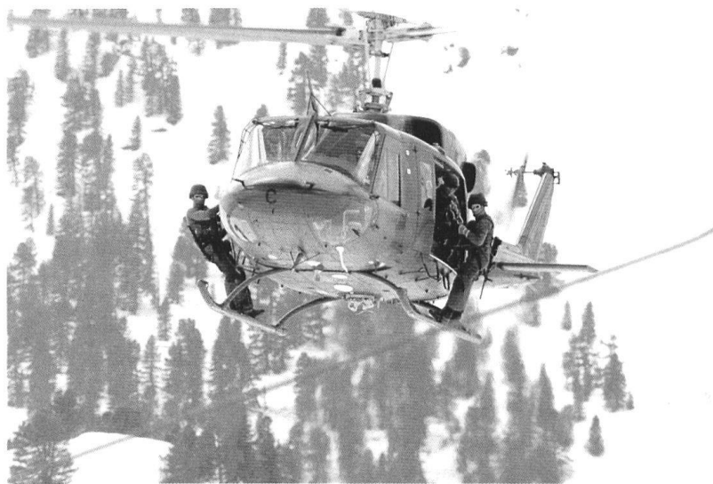
La politique de l'image doit prendre en considération le lien étroit qui existe entre l'image et la réalité.

Les images apparaissent rapidement et changent tout aussi rapidement. Cela est dès lors aussi bien leur risque que leur avantage: elles peuvent être corrigées. L'image a une importance particulière, peut-être démesurée dans la formation