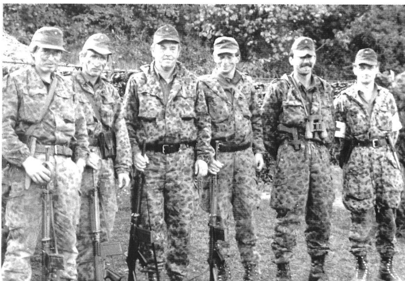
Une raison de scepticisme : si l'armée austro-hongroise et la puissante armée allemande ont été vaincues, comment la petite armée autrichienne pourrait-elle gagner une guerre ?

catif, par la représentation de leurs propres intérêts, pour qu'ils puissent finalement aussi se faire accepter.