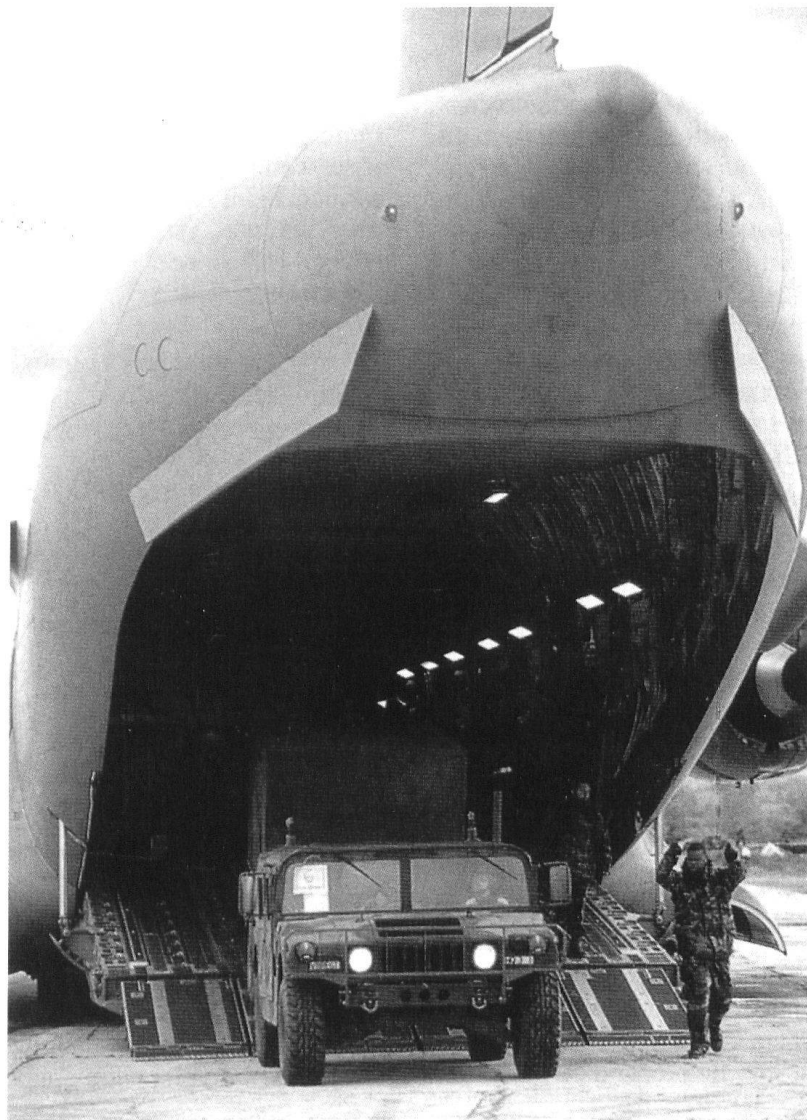
Transport partiel des matériels par la voie des airs.