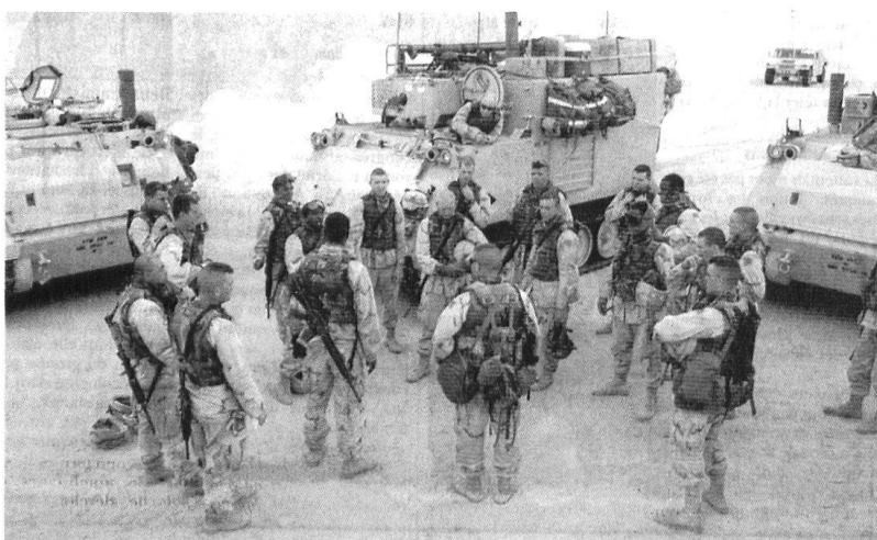
Des forces terrestres équipées de blindés lourds.

ble. Les frappes aériennes ou navales par missiles de croisières Tomahawk offrent une flexibilité totale et une réversibilité d'emploi à l'échelle de la planète.