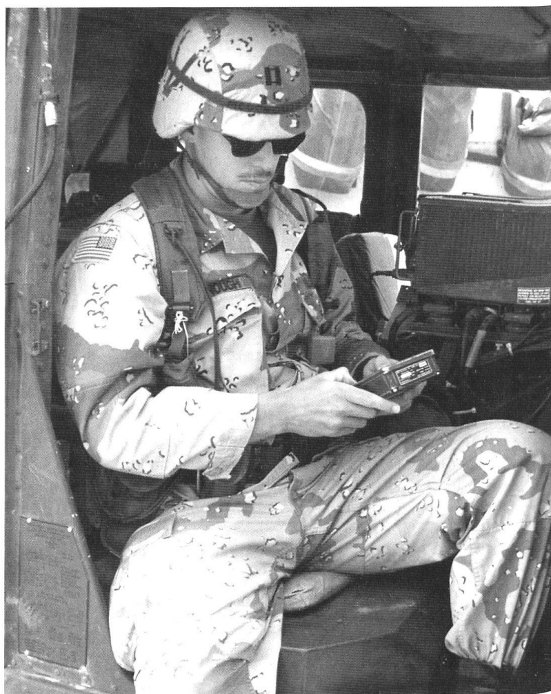
Le combattant américain dispose de moyens très sophistiqués. Ici le GPS.

La problématique est de pouvoir agir à l'extérieur sans retourner l'opinion contre soi. Les troupes sont déployées pour une opération ou pour la protection des intérêts américains en jonction ou non avec des alliés. Dans les opérations balkaniques des années 1990, les Etats-Unis se sont réservés l'appui aérien et les Européens ont eu le rôle de «piétaille». La réversibilité est un des objectifs de tout engagement de basse intensité. Des membres de la Garde nationale et de la Réserve sont mobilisables, mais avec un préavis plus long. Ils assurent la relève dans le cadre d'un dispositif d'observation dura-