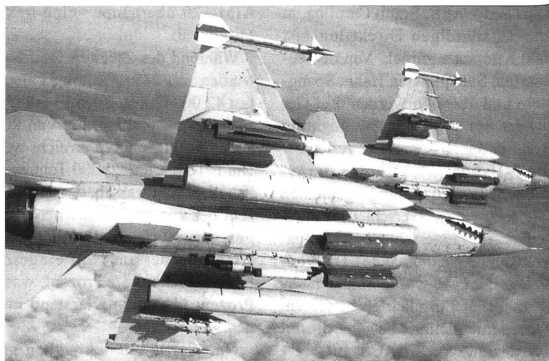
Une suprématie aérienne totale...

Nord communiste. Depuis l'été 2002 pour l'Irak et décembre 2002 pour la Corée du Nord, le casus belli est l'annihilation des armes de destruction massive (nucléaires, biologiques, chimiques). Le terrorisme de masse ou hyperterrorisme, annoncé par l'auteur dans la RMS de juin-juillet 2000, favorisé par la mondialisation des transports, peut frapper les Etats-Unis ou ses alliés avec ces moyens fournis par un «Etat-voyou».