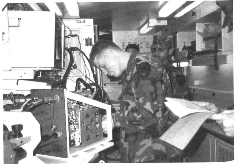
Des membres des forces américaines stationnées en Corée du Sud.

La doctrine globalisante américaine (politique, économique et militaire) dispose, avec la Grande-Bretagne, d'une puissante tête de pont européenne. Washington, qui ne craint au-