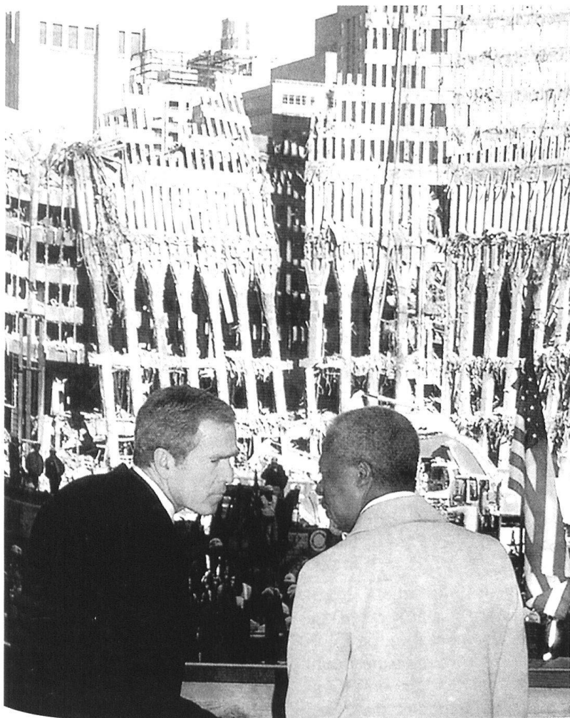
Le président des Etats-Unis devant les ruines des « Tours jumelles »

Au-delà de la tragédie, de ses tenants et aboutissants, ce qui continue sans répit, c'est le combat du pouvoir. L'administration Bush ne s'est pas arrêtée au « Ground Zero », qui sera un mémorial aux ruines écono-