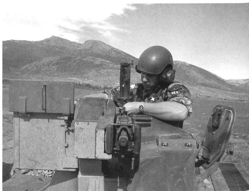
Même à l'engagement, l'instruction ne doit pas être oubliée.

pour un fusilier disposant en sus de l'appui d'une mitrailleuse lourde prête au tir!