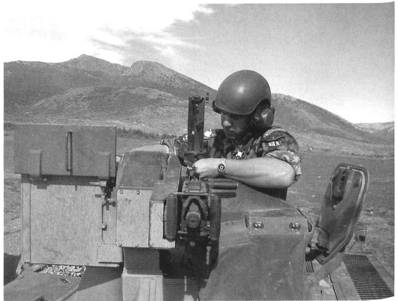
Même à l'engagement, l'instruction ne doit pas être oubliée.

pour un fusilier disposant en sus de l'appui d'une mitrailleuse lourde prête au tir!