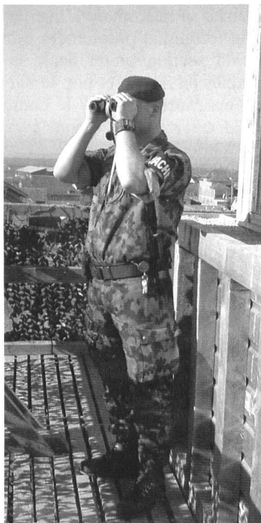
La garde fait aussi partie des missions de la section.

Le passage rapide d'un état de préparation «jaune» à «rouge», l'exercice de missions de sécurité au sein d'une population civile pas forcément hostile mais qui représente toujours des risques... Rien de neuf pour un policier, mais beaucoup d'éléments à maîtriser