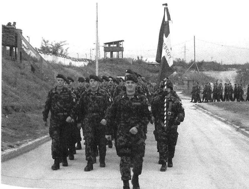
La compagnie de service est emmenée par la major Ott.

gagé. De ce fait, la section ne compte pas trois, mais quatre groupes, en plus d'un char de commandement. Le groupe est considéré comme un système à deux composantes, infanterie et véhicule d'appui.