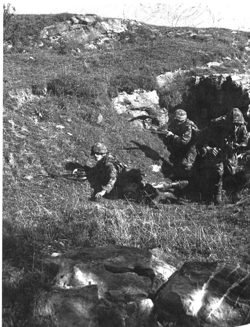
Prêts pour l'assaut...

Le 20 juin 1940, au moment où les premiers éléments du corps français du général Daille franchissent la frontière, le 1 er corps roque sa 2 e divi-