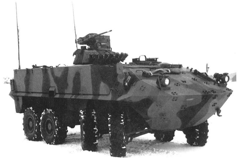
Le char de grenadiers à roues.

Dans le domaine de l'instruction, la collaboration interarmes fait l'objet, depuis de longues années, d'exercices et de manœuvres. Elle s'intensifie en fonction de la complexité croissante des matériels. Depuis les années 1970, des engagements conjoints de troupes de formations différentes se déroulent chaque année, à des saisons différentes et concernent toutes les formations à