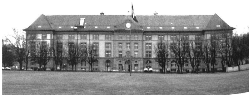
Die Kaserne Bern.

Im Innern der Kaserne, welche im übrigen von der Mezerkaserne in Mannschaftska-