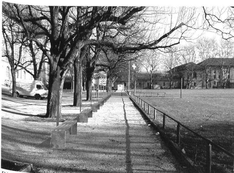
Die Gestaltung des Aussenraumes soll den Besucher vom Treffpunkt des Restaurants zur Kaserne führen und mit je einer Stele und einer Bank an einen der Division unterstellten Verband erinnern.

serne der Berner Truppen umbenannt wird, werden zwei Räume und ein Lichthof gestaltet.