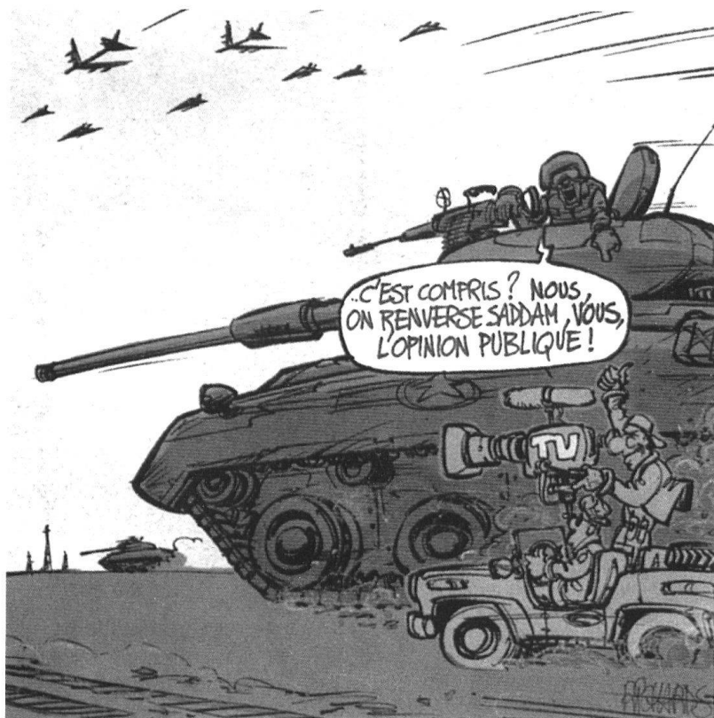
Guerre des images : les médias sont en premières lignes. Vu par Richards. (Coopération, 26 mars 2003).

L'évaluation des possibilités d'actions adverses est un élément central de toute planification. Traditionnellement, le renseignement militaire se concentre sur les moyens disponibles en personnel et en matériel pour en déduire les capacités des forces opposées; l'intention de leurs chefs est prudemment délaissée, en vertu du principe qu'il est plus simple – donc bien plus probable – de changer d'intention qu'obtenir des capacités différentes. Face à des formations armées régulières, organisées en fonction d'une mission, unifiées par une doctrine homogène, cherchant à atteindre les buts stratégiques fixés par l'échelon supérieur et astreintes aux lois de la guerre, cette méthode a fait ses preuves. Le nombre d'actions susceptibles d'être entreprises par une brigade mécanisée, une escadrille de chasseurs-bombardiers ou une frégate lance-missiles reste limité. Les performances de leurs équipements peuvent être quantifiées dans l'espace et dans le temps, numérisées avec précision et utilisées dans une simulation infor-