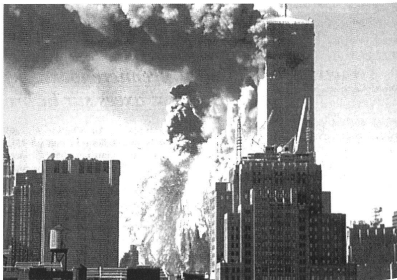
Depuis les attentats du 11 septembre 2001, la peur n'a jamais été aussi présente dans le monde des médias.

Enfin, le tempo et l'intensité des conflits modernes sont à l'opposé des guerres conventionnelles 2 . De nos jours, les forces gouvernementales ne doivent pas réagir à des engagements tactiques s'enchaînant à grande vitesse, mais prévenir des actions d'ampleur stratégique largement espacées dans le temps. La portée et la précision des armements modernes ont raréfié et raccourci les conflits symétriques, en donnant aux armées digitalisées un a-