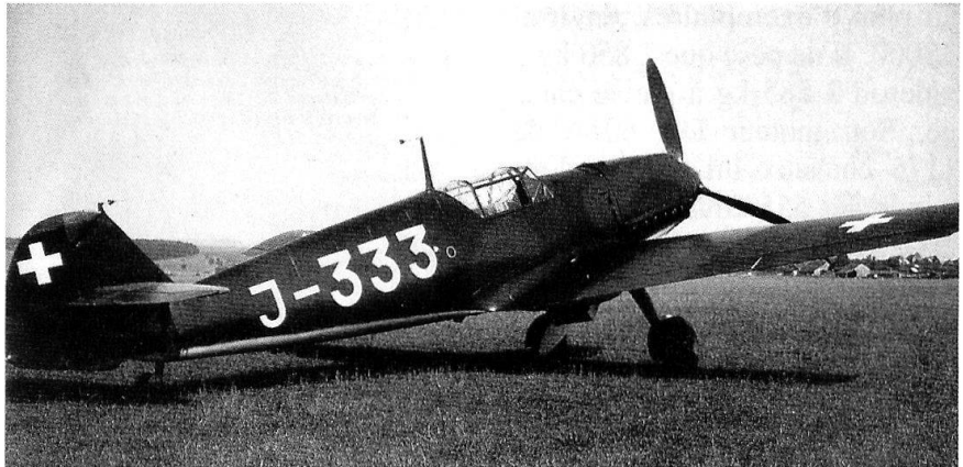
Le puissant Messerschmitt Bf-109 a posé autant de problèmes qu'il en a résolu.

Malheureusement, la production du D-38 ne va pas sans peine. Le démarrage de la produc-