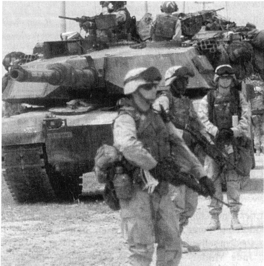
Une armée hyper-sophistiquée et dotée des matériels les plus performants, suffit-elle à vaincre l'hyper-terrorisme ?

C'est cette nuance qu'apporte Richard Labevière, rédacteur en chef de Radio France Internationale (RFI). Une nuance tout en douceur qui permet de relativiser les certitudes d'observateurs dont certains, experts et journalistes, se sont décrétés spécialistes de l'organisation « La base », c'est-à-dire Al Qaïda. Lors d'un colloque organisé par l'Institut Diplomatie et Défense, sous l'égide de la Commission de la Défense nationale de