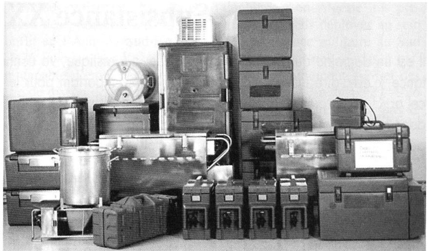
Equipement de cuisine.

Il ne faut pas oublier tout le matériel complémentaire pour l'exploitation et l'entretien de cette cuisine mobile. Ce matériel sera transporté, soit sur une remorque, soit dans un conteneur, (non encore décidé à ce jour).