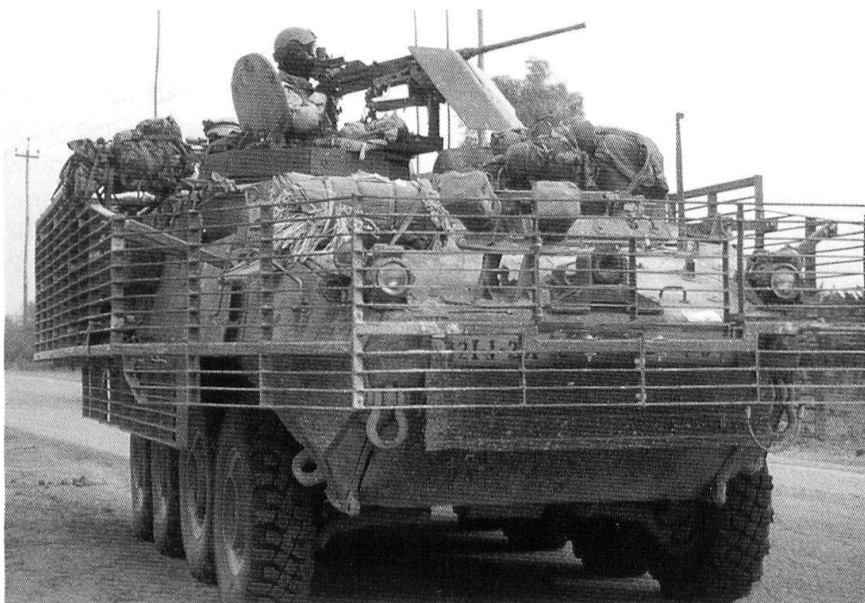
Un Stryker transporteur de troupe, quelque part en Irak.

Le poids du Stryker n'est pas son seul défaut. Malgré sa très grande silhouette par rapport à ses concurrents, la version de base «Transporteur de troupe»