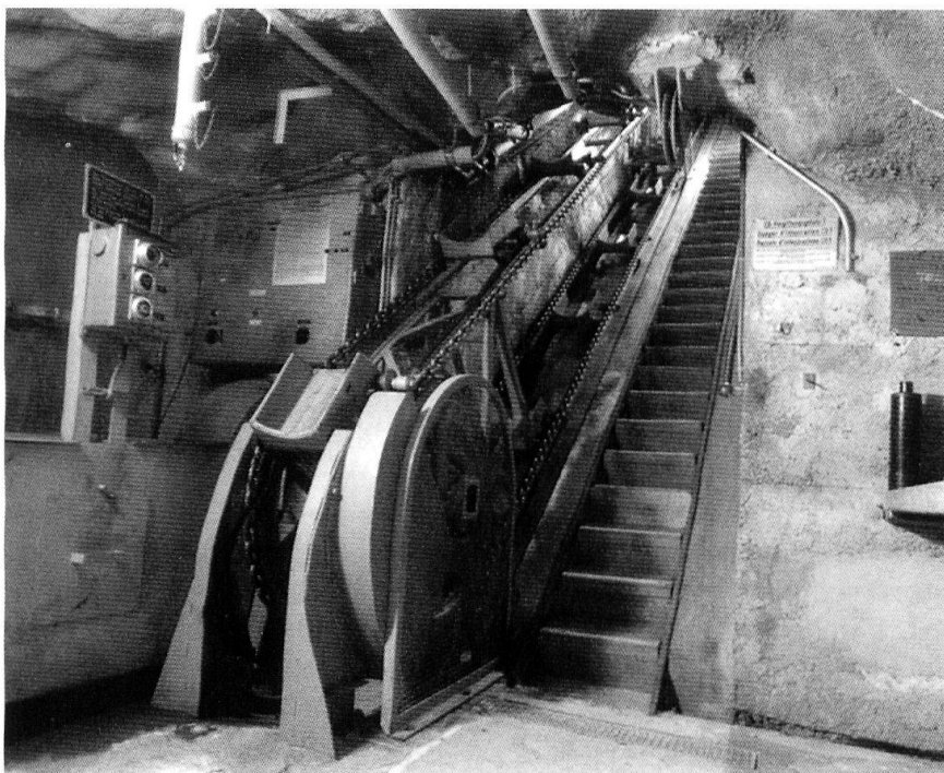
Dailly: bas de l'accès à la tourelle de 10,5 cm.

Les conditions de vie des hommes, qui doivent faire dans les ouvrages des séjours plus ou moins prolongés, sont dures, surtout pendant les services actifs, quand on ne sait pas quand on rentrera à la maison et si le pays ne sera pas envahi. La promiscuité, l'absence de locaux pourvus de commodités, l'espace confiné peuvent rendre encore plus lourds les soucis civils. Il faut lutter contre «l'usure». Dans la position fortifiée de Saint-Maurice entre 1939 et 1945, les commandants comprennent la nécessité de stationnements à l'air libre, parfois des cabanes de montagne où les hommes peuvent «récupérer» et, pour les troupes de forteresse, les avantages de la marche en terrain varié, du sport, voire du ski.