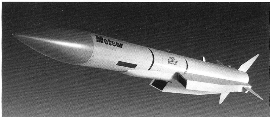
Missile air-air à moyenne portée Meteor.

De par son histoire, ses choix et ses ambitions, MBDA se démarque de la concurrence par la garantie offerte à ses partenaires de leur fournir un accès