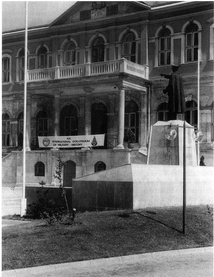
Istanbul: une statue de Mustafa Kemal Atatürk devant le Musée de l'armée.

Il faudra également que l'Union européenne s'accommode de l'état des affaires à Chypre. En 2003, la Commission de Bruxelles avertissait Ankara: si le problème posé par la division de Chypre n'était