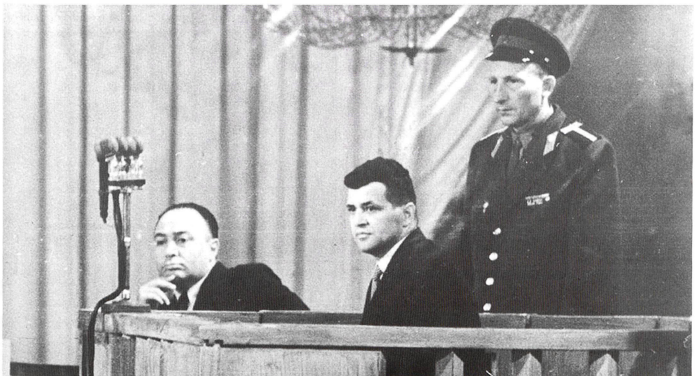
Le procès pour espionnage de Francis Gary Powers, pilote de la CIA abattu avec son U-2 sur l'URSS en 1960.