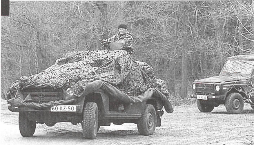
Traditionnellement, l'Union européenne a déployé des formations de maintien de la paix ou de stabilisation légères... donc vulnérables