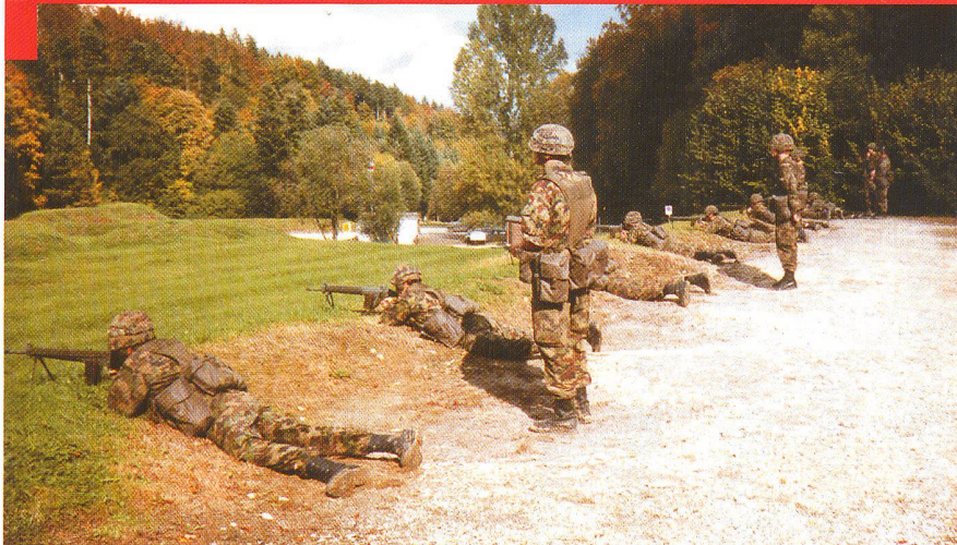
Instruction au tir, place d'armes de Bure (JU)