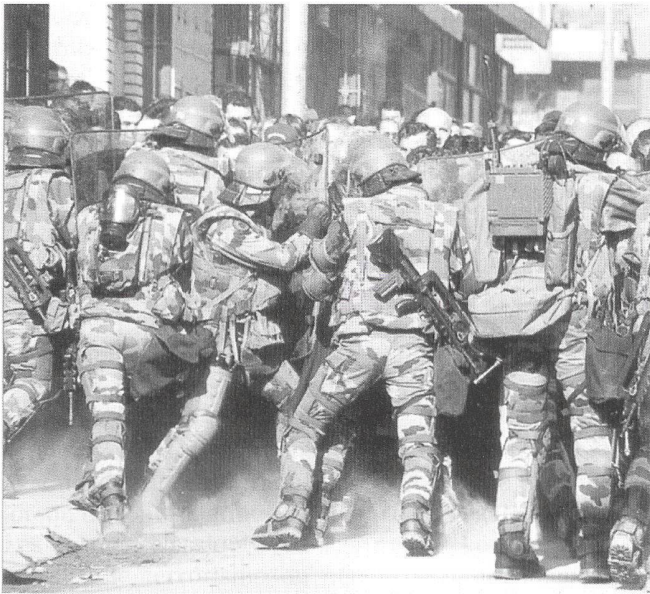
Les actions en zone urbaine peuvent tenir du combat, du maintien de l'ordre comme ici à Mitrovica en 2000, ou être de nature subsidiaire ou d'assistance humanitaire.