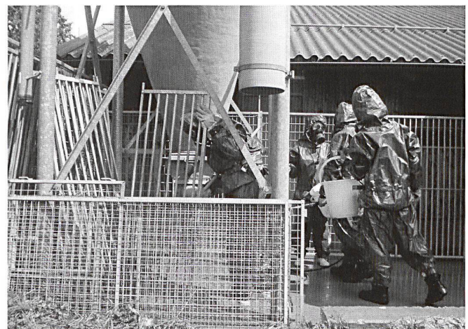
Sdt vétérinaires procèdent à la désintoxication d'une exploitation avicole.

civil), Denis Froidevaux, en collaboration avec le vétérinaire cantonal, le Dr Jacques-Henri Penseyres. Pour renforcer le dispositif civil de lutte contre les maladies animales infectieuses, le canton a demandé l'aide subsidiaire de l'armée, qui possède une section vétérinaire mobilisable en quelques heures. Cette rapidité d'action est cruciale dans un cas d'épizootie, où les premières heures sont déterminantes afin d'éviter une possible propagation de la maladie.