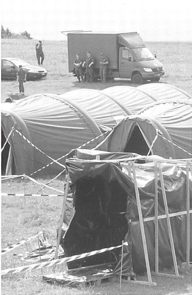
3 Sas d'entrée/sortie de la zone contaminée avec, à l'avant, un passage de décontamination avec douche.