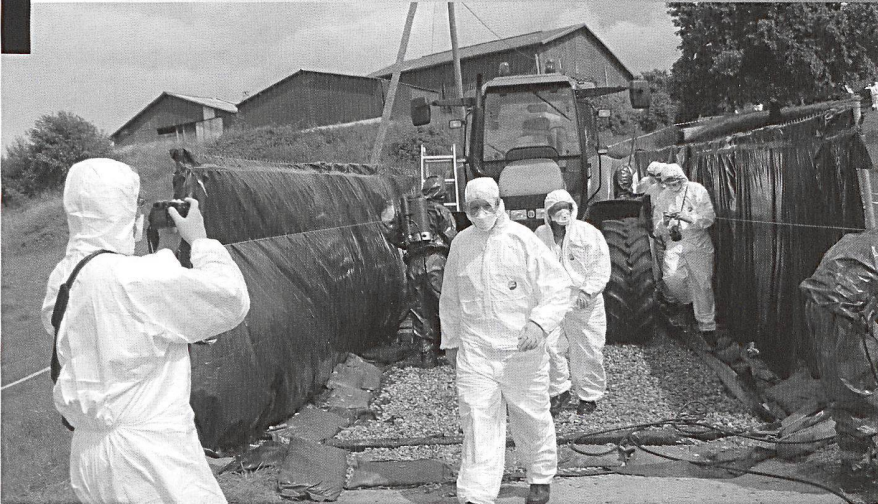
Autoluvé monté par une formation d'intervention en cas de catastrophe.