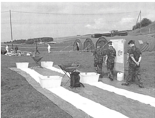
Zone/parcours de décontamination NBC.