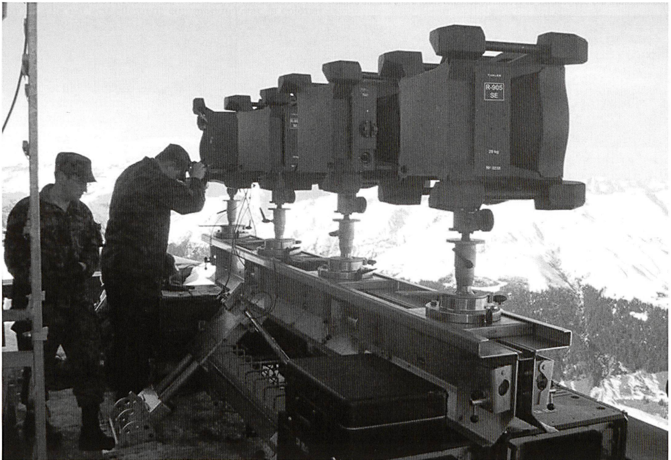
Une concentration de stations à ondes dirigées (ondi) R-915.

Les visiteurs ont pu découvrir l'intégralité des compétences du bataillon. Non seulement les moyens de télécommunication, mais aussi les moyens de transports, moyens sanitaires et moyens à disposition d'un état-