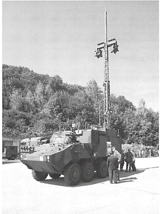
Lors d'engagement mobiles, ou pour renforcer les concentrations fixes, le RAP-Panzer est engagé.

Démonstration des équipements de la salle de conduite (TOC) d'une Grande Unité.