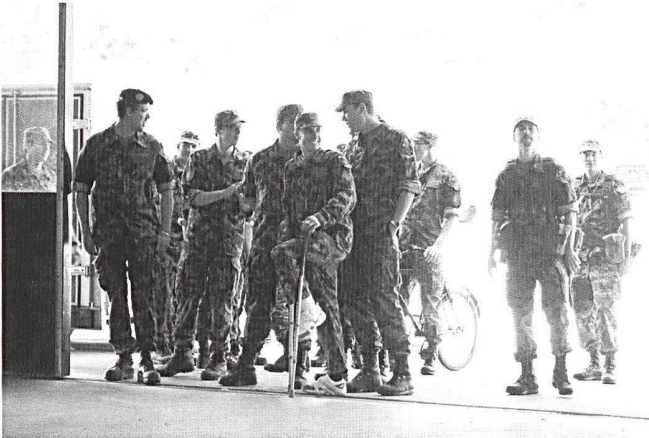
Effervescence à Moudon pour l'organisation d'une journée portes ouvertes.

La troupe a bien joué le jeu, chaque poste a été présenté avec plaisir et interactivité. Montage, démontage des armes, matériel de cuisine de campagne, radio SE-430, SE-235 ou encore RITM avec possibilité d'essayer les appareils. L'intérêt des visiteurs était bien présent !