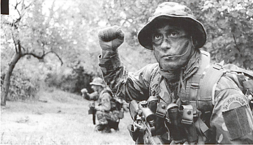
Illustrations © Forces spéciales turques