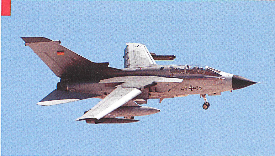
Le Tornado est la monture principale de la Luftwaffe et de la RAF. Il est ici équipé de pods de guerre électronique et de bidons.