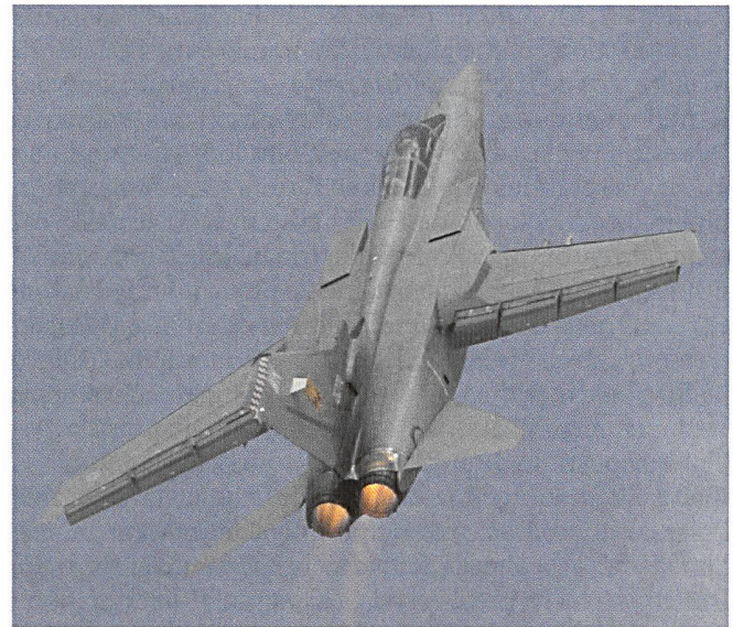
Le F.3 est étonnamment agile, une fois délesté de 6 tonnes de charges externes.

Pour ce faire, un consortium trinational est mis sur pied : PANA VIA, regroupant British Aerospace (BAe 42,5 %), Messerschmitt (MBB 42,5 %) et Aertilia (Alenia 15 %). Le but est de développer un avion de combat multirôle (MRCA) prévu pour entrer en service en 1975. L'industrie allemande est responsable de la cellule, les entreprises britanniques du cockpit et de l'empennage, enfin les firmes italiennes produisent les ailes. L'abandon de plusieurs partenaires initiaux, qui optent