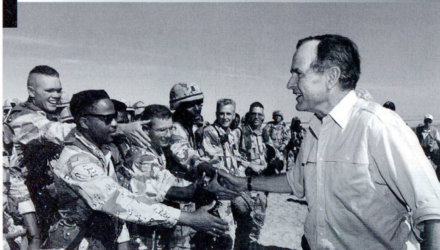
Le «Nouvel Ordre mondial» a été développé en 1991 sous la base d'une Omnipuissance militaire et politique américaine.