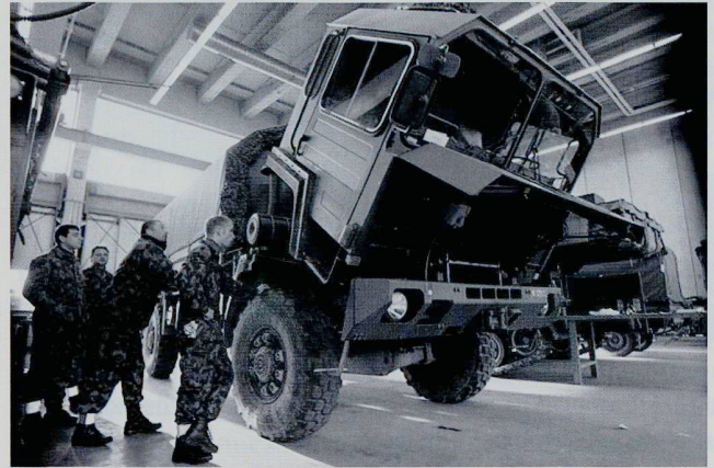
On fait appel aux artisans de troupe pour renforcer les installations de la Base logistique de l'armée.

Ces mesures permettent d'obtenir une amélioration provisoire dans des domaines particuliers. Les causes