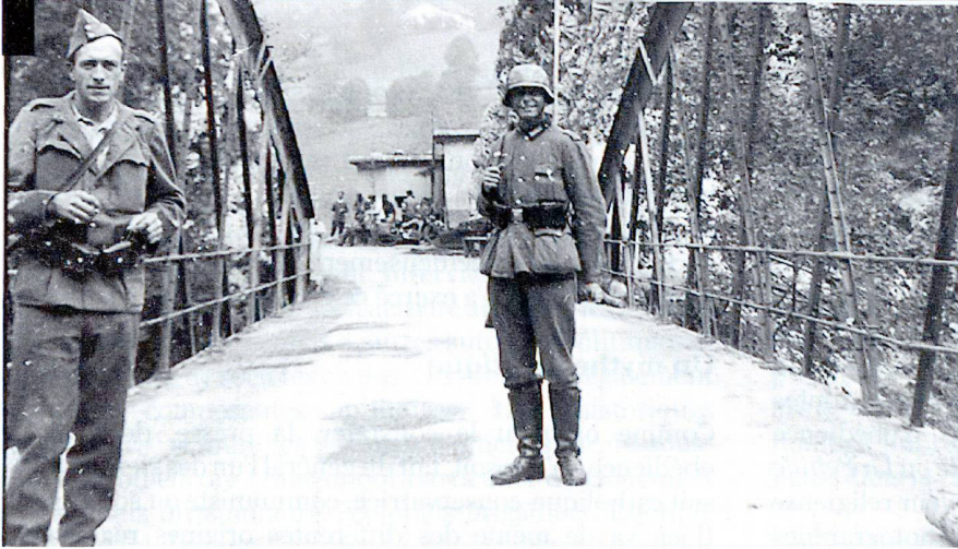
Un soldat suisse (sans casque) et un soldat allemand (casqué) à la frontière. De dos, de nuit et par le brouillard... la confusion est possible.