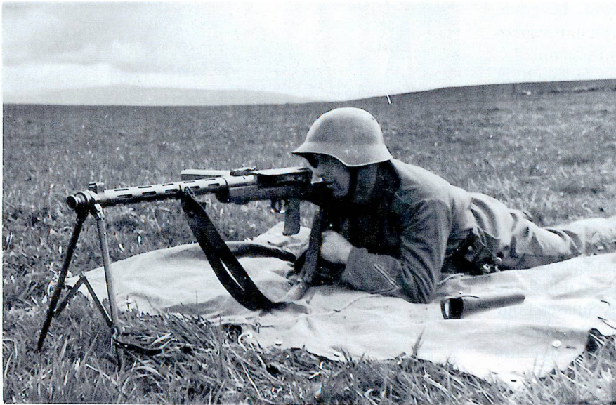
Un soldat tire au fusil-mitrailleur modèle 1925.

On découvre également des armes fabriquées par la résistance danoise dont des pistolets factices, en bois, qui ont permis à des prisonniers de s'évader, ainsi que des copies de pistolets-mitrailleurs Sten élaborées de manière artisanale dans des ateliers clandestins, parfaitement aptes au tir. La technique de fabrication de faux papiers pour les agents alliés et la résistance danoise est aussi expliquée de manière vivante et passionnante.