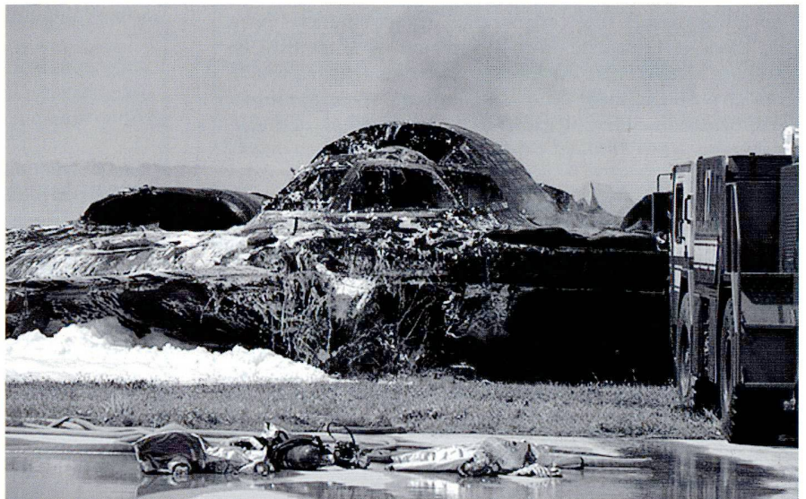
L'épave du Spirit accidenté à Guam.

A 10h29, l'équipage enclenche les radiateurs de bord ; l'eau s'évapore mais les capteurs indiquent désormais une pression trop faible. A 10:30:12, le bombardier commence son décollage sur la piste 06R d'Andersen AFB. L'appareil roule, mais l'ordinateur de bord indique une fausse vitesse relative. Le pilote tire donc sur le manche à une vitesse de 133 nœuds au lieu des 145 requis pour le décollage. 38 secondes plus tard, l'appareil est en perte de vitesse et l'ordinateur de bord prend automatiquement les commandes ; croyant faussement que l'avion pique du nez, le pilote automatique lève le nez de 30 degrés. En stall , le B-2 s'incline sur la gauche et l'aile touche le sol. A ce moment, les deux membres d'équipage s'éjectent. L'appareil s'écrase en bout de piste. Le second appareil, déjà en l'air, reçoit