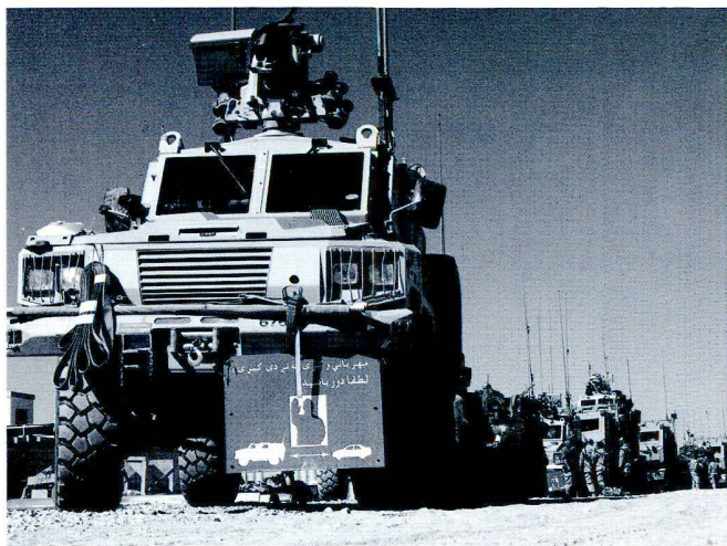
De nouveaux véhicules, mieux protégés – en particulier contre les mines – ont été acquis sur étagère pour équiper les troupes canadiennes.

Le ministère du Budget canadien, dans un rapport au Parlement d'octobre 2008, chiffrait les coûts entre 7,7 et 10,5 milliards de dollars américains, dont 5,9 à 7,42 milliards pour financer les opérations militaires. Moins d'un milliard est consacré à l'aide au développement. Le reste sert à payer les pensions des vétérans ou des familles de militaires tués. Mais cette étude laisse de côté les coûts administratifs, les salaires ainsi que les acquisitions d'équipements militaires en urgence. 4 Un rapport de David Perry, ancien directeur du centre de Politique étrangère de l'Université Dalhousie estime le coût des opérations à 22 milliards de dollars. 5 Dans la ligne des critiques des médias américains, au Canada des voix s'élèvent contre le manque de transparence dans les budgets et les dépassements répétés de crédits. 6