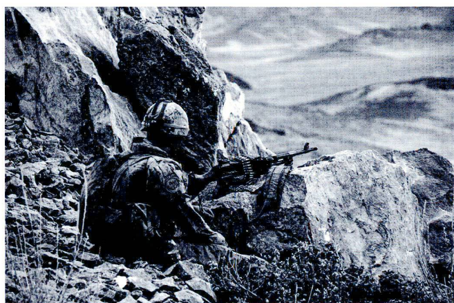
Chaque action ne peut avoir lieu que si elle est « assurée » et « couverte » par l'observation et le feu.

Rappelons cependant que depuis 2002, les forces armées canadiennes ont permis de désarmer et neutraliser 10 000 armes lourdes (artillerie, chars et lance-roquettes) et a permis d'éliminer un tiers des 10 à 15 millions de