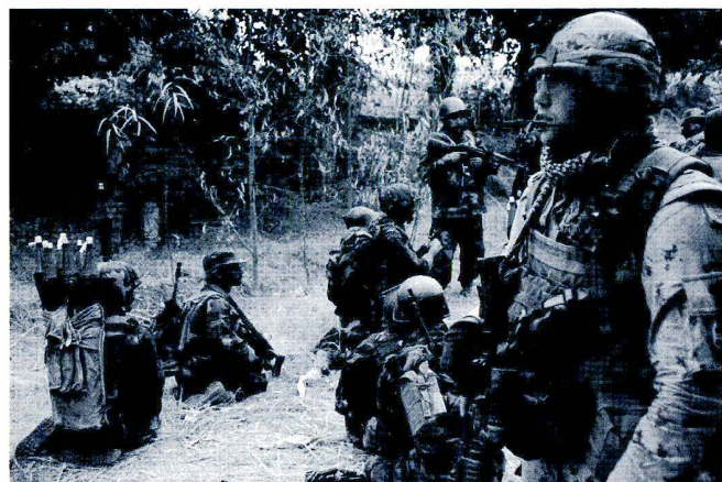
L'armée canadienne forme et encadre l'armée nationale afghane dans des missions de stabilisation et de nettoyage.

Cette opération est passée sous la responsabilité de l'OTAN le 11 août de la même année. Jusqu'au 4 janvier 2004, la première phase de l'opération a visé à garantir la sécurité dans Kaboul durant le temps nécessaire pour que la Loya Jirga développe et ratifie une constitution