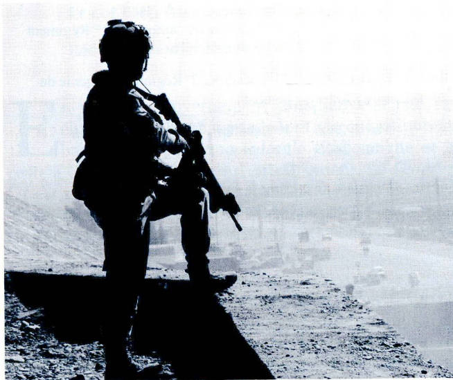
Comme dans un engagement conventionnel, la maîtrise des hauteurs permet de protéger les forces des surprises et de réagir de manière efficace.