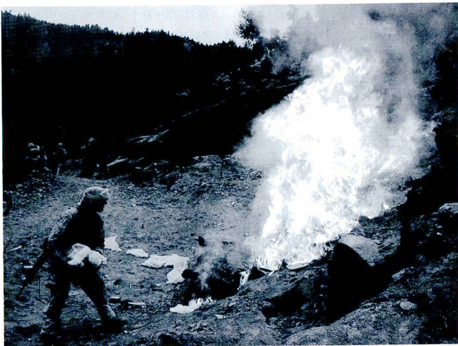
Les raffles permettent de découvrir et de détruire des stocks importants de narcotiques (opium) produits en Afghanistan.