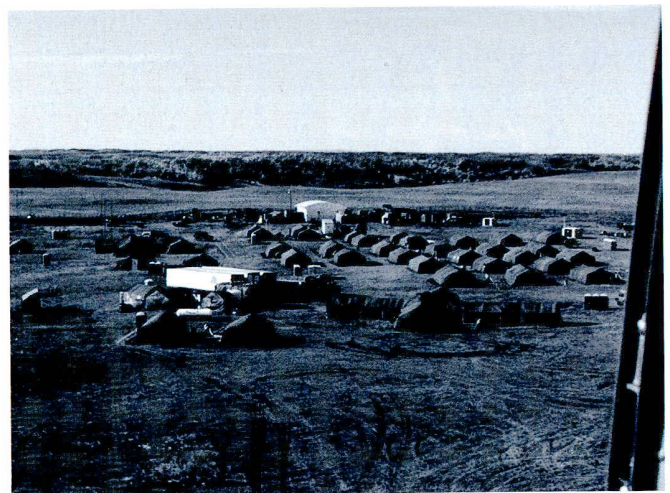
Les cantonnements des forces canadiennes sont concentrés à Kandahar.