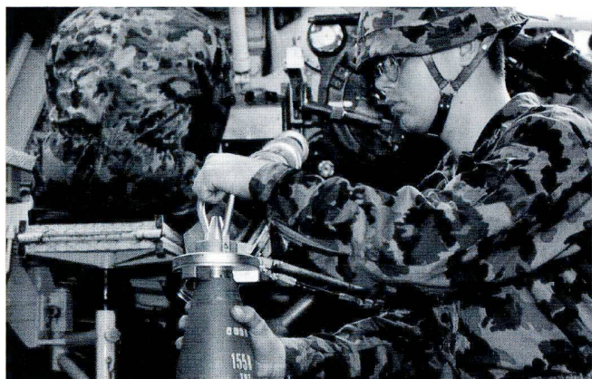
Les obus sont le cas échéant « tempés » à l'intérieur de la pièce à l'aide d'une clé.