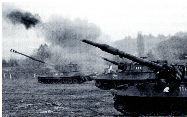
Une batterie de 6 pièces ouvre le feu. En Suisse, la munition cargo n'est pas utilisée pour les tirs d'entraînement en temps de paix.