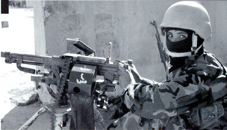
L'armée irakienne est formée et équipée par les forces de la Coalition, menée par les Américains.