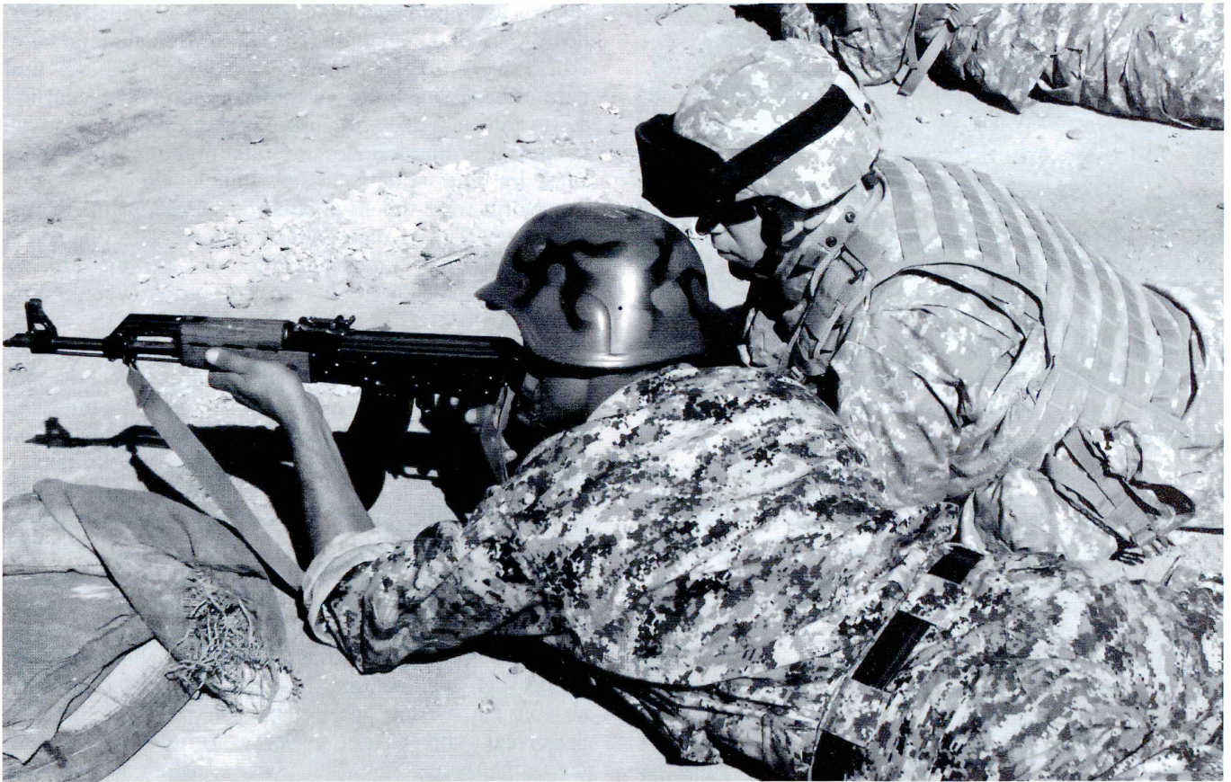
Instruction au tir et encadrement de soldats de l'armée nationale afghane (ANA) par des moniteurs américains.

und militärischen Operationen. Da die Sicherheits-Agenten selbst die professionelleren Experten in Sachen Sicherheit sind, ist ihr eigener Ratschlag vital für eine gelungene Sicherheitspolitik. Gleichzeitig benötigt eine Administration in demokratischen Staaten eine hinreichende Anzahl zusätzlicher, ziviler (Sicherheits-)Experten, die in Verteidigungsministerien und dem Parlament eine wichtige Scharnierfunktion innerhalb der ZMB wahrnehmen. Nicht zuletzt sollte stets eine breitere Öffentlichkeit von unabhängigen Journalisten und zivilgesellschaftliche Institutionen gefördert werden, die sich regelmässig und informiert mit Sicherheits- und Verteidigungspolitik auseinandersetzen. Denn in einer demokratischen Gesellschaft darf die Formierung einer ‚Sicherheits- und Verteidigungsgemeinschaft‘ nicht einem exklusiven Club von Agenten und informellen Kreisen vorbehalten sein. Sie muss notwendigerweise, wenn auch differenziert, eine breitere, über die Staatlichen Gewalten hinausreichende Experten-Gemeinschaft miteinbeziehen. Sektoren-übergreifenden öffentliche Debatten, die über die Parlamente hinausreichen, sind ein wichtiger Bestandteil gerade auch im Prozess der Formulierung von Sicherheitspolitik.