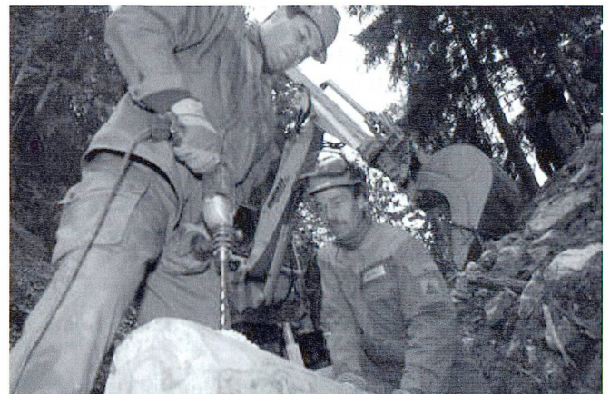
Une large place est faite pour présenter les contributions de la Protection civile (PCI).