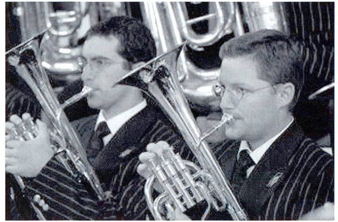
Le stand de l'armée sera animé par le Brassband et des défilés de mode.

Horaires exacts et emplacements à découvrir chaque jour sur le programme des événements du DDPS !