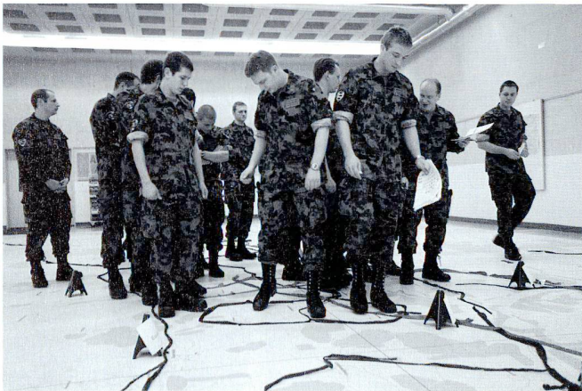
Drill d'ordres par le commandant de bataillon : l'action est répétée plusieurs fois, avec les commandants de compagnie puis avec les chefs de section.

l'ELTAM, si bien que les commandants peuvent conduire leurs unités au combat dans une situation quasi réelle, bien que tout ceci ait lieu sans troupe, sans véhicules, sans carburant et sans munition.