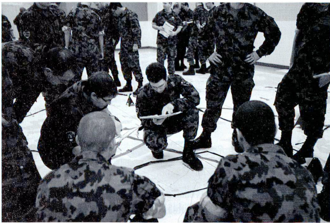
Après avoir reçu leurs ordres, chaque « Team » -ici les officiers de la cp chars 17/3 et de la cp gren chars 18/2- coordonnent leur action sur le modèle de terrain.