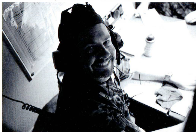
Dans le char du remplaçant (002), le S1, S3 et S4 (ci-dessus) préparent la planification prévisionnelle et subséquente.