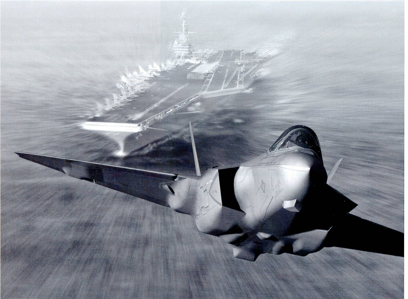
La relève des appareils de l'US Army et de la Navy repose entièrement sur le F-35 Lightning II .