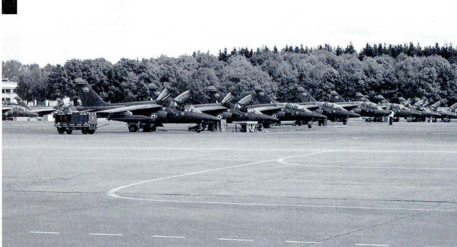
Visite de la base aérienne (BA705) de Tours, en mai 2009.