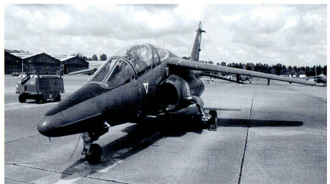
Alphajet : avion école de la chasse française sur la base de Tours.

Les buts principaux de notre section sont de promouvoir les contacts entre officiers ayant servi dans les Forces aériennes, de perpétuer la camaraderie et de participer au perfectionnement des connaissances militaires et aéronautiques de ses adhérents.