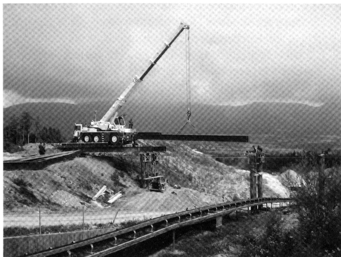
Construction d'un PPA à Arch.