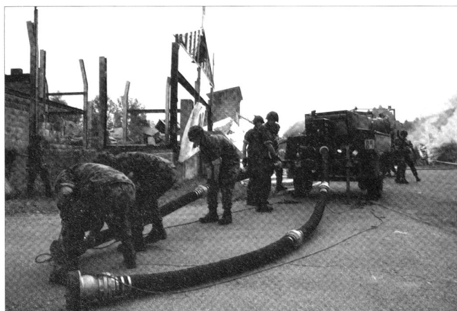
Les troupes de sauvetage peuvent également être engagées dans les cas d'incendies importants.