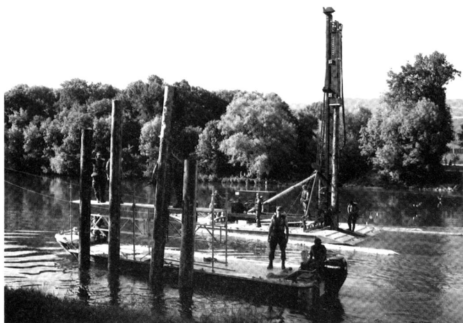
Mise en place de sonnettes pour le PPA.