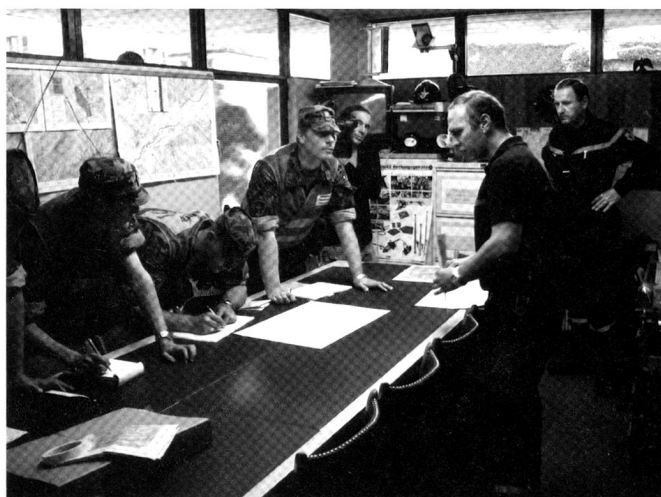
Cadres des troupes de sauvetage durant un rapport de coordination.