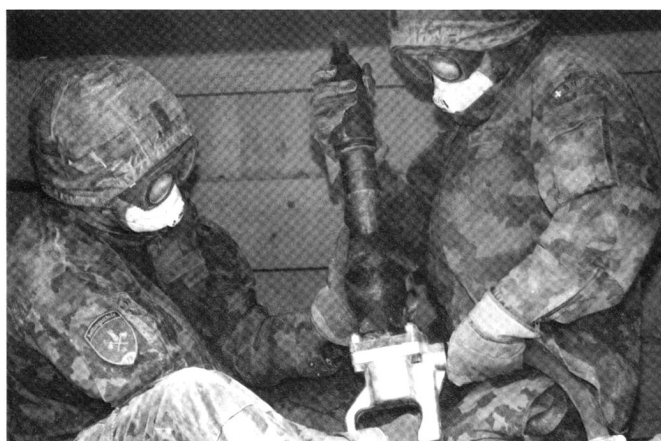
Troupes de sauvetage travaillant dans les décombres.