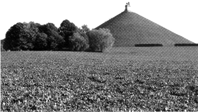
La Butte du lion, mémorial de la bataille de Waterloo (18.06.1815).