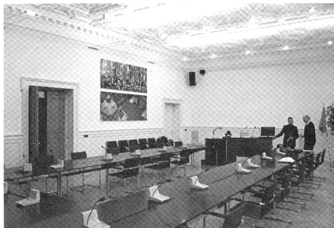
La Salle de la Commission de défense nationale (CDN).