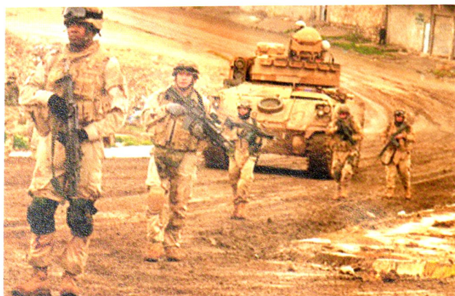
Patrouille d'un Bradley (M3A2) du 3 ACR dans les rues de Bagdad, durant le déploiement OIF3, 2004.