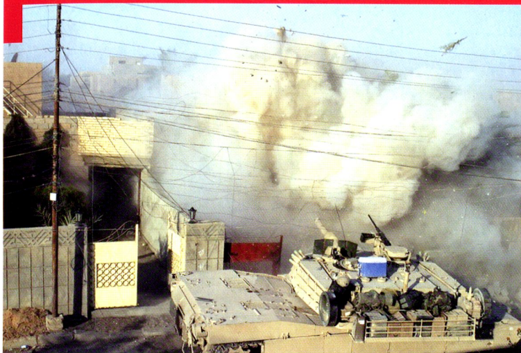
M1A1 Abrams du 3 rd ACR en combat de rues dans Falloujah, été 2004.