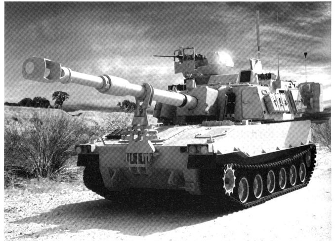
La version la plus moderne, M109 A6 Paladin .

Quelque 60 participants ont accompli le stage FACCC 6-08. 46 participants sont des membres de l'US Army, 3 de l'US Marine Corps et 11 proviennent de forces armées étrangères. Le stage a duré 20 semaines au total et s'est articulé en trois blocs principaux, comme suit : nous avons traité l'instruction de base de l'artillerie dans le Gunnery Block. Parmi les sujets abordés figurent le calcul manuel des éléments de tir, le dessin de cartes de sécurité, la recherche et l'élimination systématique des erreurs et la conduite des tirs. Le Joint and Combined Arms Block a pour but d'enseigner les bases opératives et tactiques pour pouvoir être ensuite engagé dans un état-major de bataillon en qualité d'officier d'appui de feu ou de collaborateur d'état-major. Nous avons abordé l'ensemble des opérations offensives, défensives, de stabilisation et d'appui. 2 Le Battery Command Block à la fin du stage est conçu pour fournir le savoir faire pour pouvoir conduire une unité dans une caserne aux États-Unis mais également à l'engagement n'importe où dans le monde. Suite au stage à Fort Sill, j'ai eu la possibilité faire partie d'un bataillon d'artillerie qui se préparait à un engagement imminent.