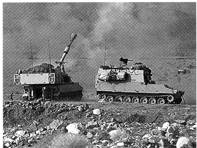
M109 et M992 à l'entraînement, au NTC de Californie.

Le besoin d'un remplaçant au M109 a également diminué en raison de la production, entre 1983 et 2003, de quelque 1'300 lance-fusées multiples M270 MLRS. 3 151 restent en service, à raison de 8 par batterie, afin d'assumer les tâches de l'artillerie opérative au sein des forces américaines.