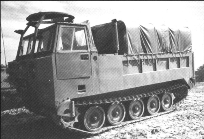
Chenillette de transport de munitions M548.