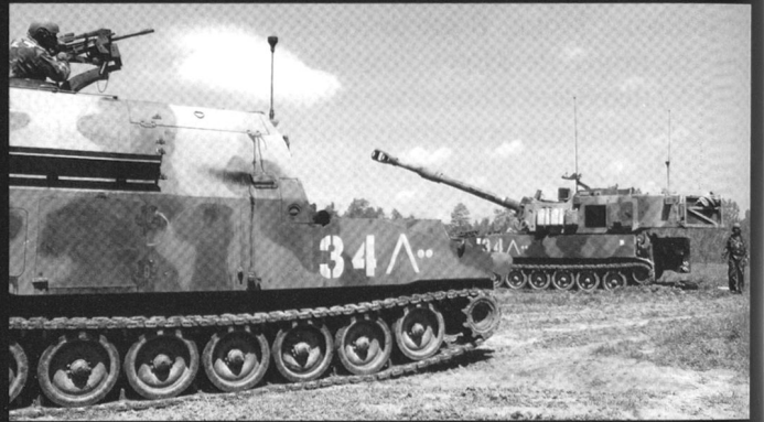
Le M109 est aujourd'hui soutenu par le M992 FAASV