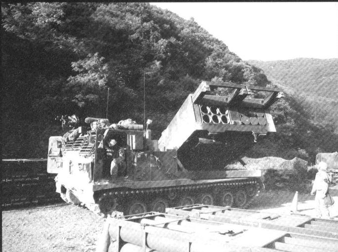
Le lance-fusées multiple (MLRS) assure l'appui opératif des Grandes unités américaines.