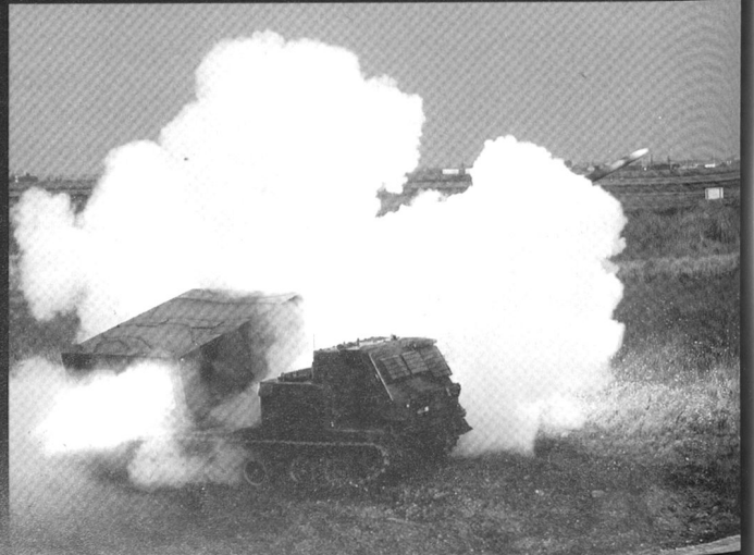
Le MLRS peut combattre des buts à des distances de 45 km.