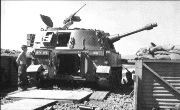
Le M108 d'origine emportait un obusier de 105 mm