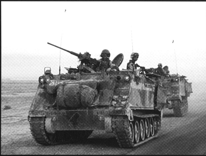
Plusieurs versions du M113 sont utilisées pour emporter des mortiers de 81, 106 et 120 mm: M106, M120 et M125.