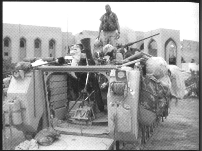
Mise en batterie d'un mortier de 120 mm en Irak. Le lance-mines est une arme essentielle dans le combat en zones urbaines (CEZU), en raison de sa grande élévation