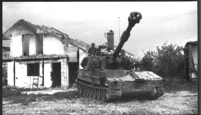
M109 de la 1 st Armored Division en Bosnie Herzégovine