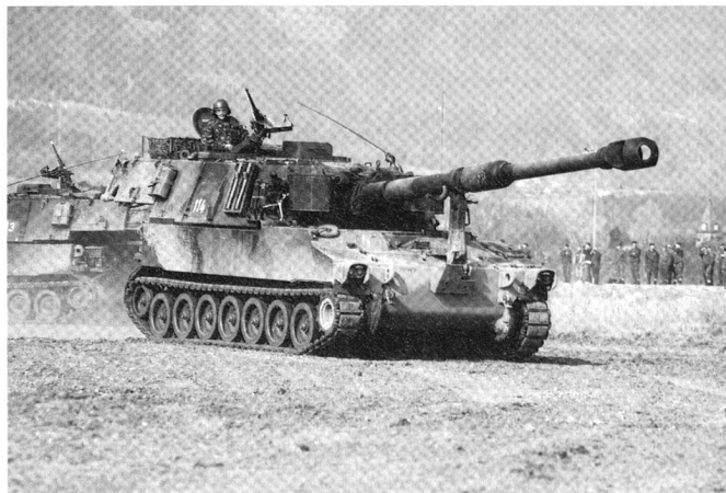
Après le tir, les pièces quittent rapidement leurs positions pour éviter les tirs de contre-batterie.