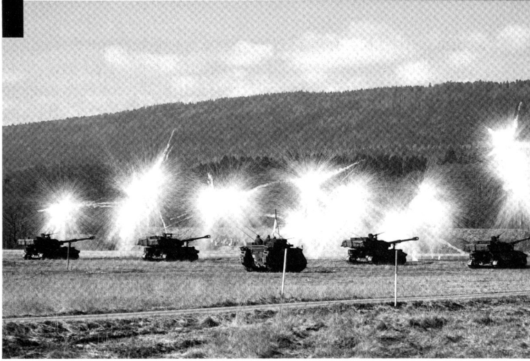
Tir de nébulogènes par une batterie d'artillerie, avant de s'éclipser.