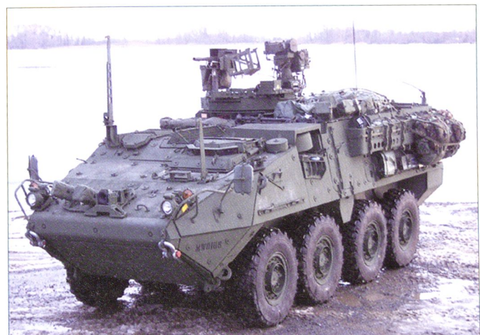
Le M1131 FSV est la version commandant de tir du Stryker .