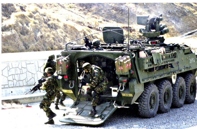
Débarquement de soldats de la 3 rd Brigade, 2 nd ID en Corée.