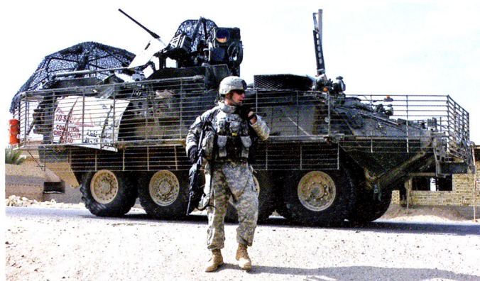
M1127 de reconnaissance de la 4 th Brigade, 2 nd ID à Ramadiyah.