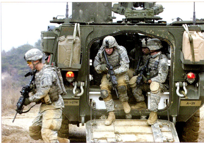
Débarquement de fantassins d'un M1126 de la 25 th ID.