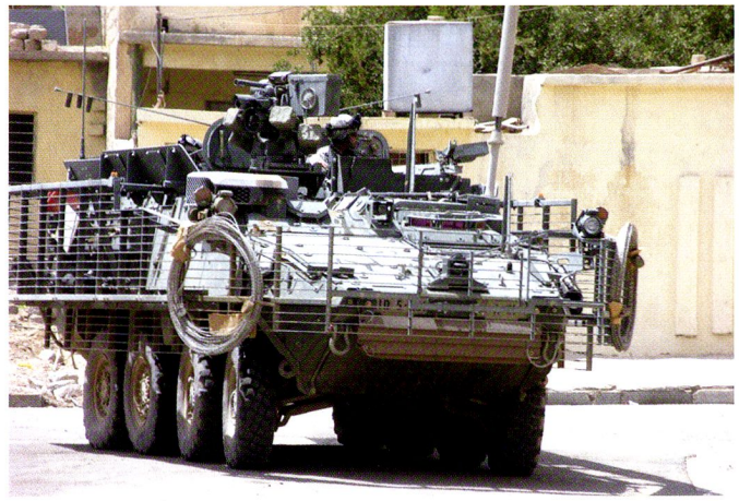
M1126 de la 3 rd SBCT à Mossoul.