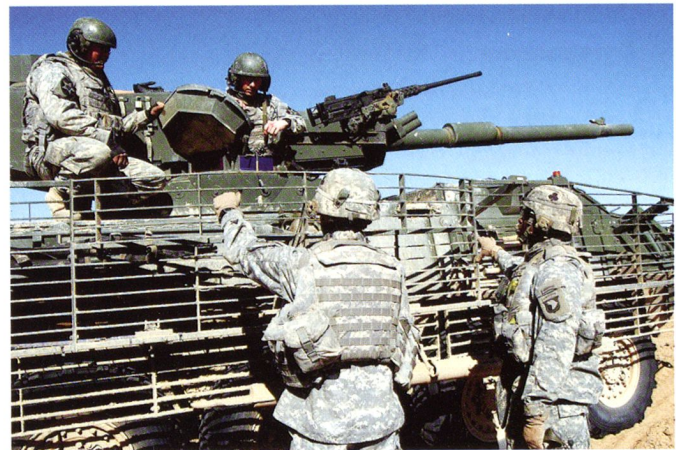
M1128 MGS du 2 SCR en Afghanistan, été 2009.