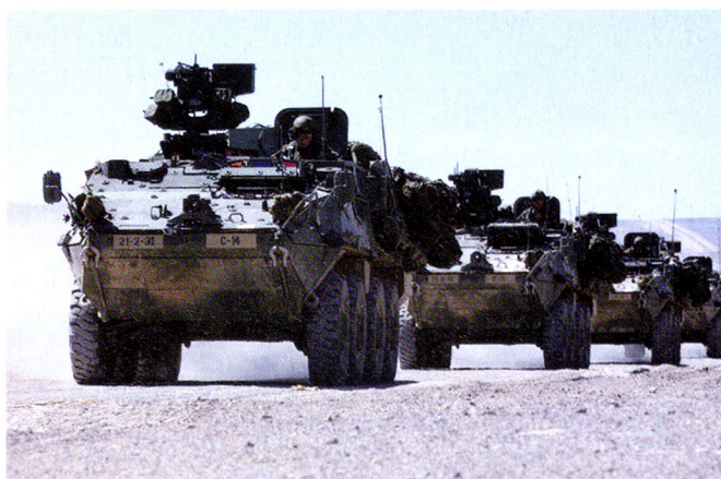
Photos prises lors des manoeuvres ARROWHEAD LIGHTNING II de la 3 e Brigade, 2 e Infantry Division au printemps 2003.

asymétriques ou symétriques, ou est confrontée à des forces insurrectionnelles voire conventionnelles. La brigade Stryker (SBCT) comble donc les lacunes entre les premières forces arrivées –forces spéciales, troupes légères- et les formations lourdes. 1