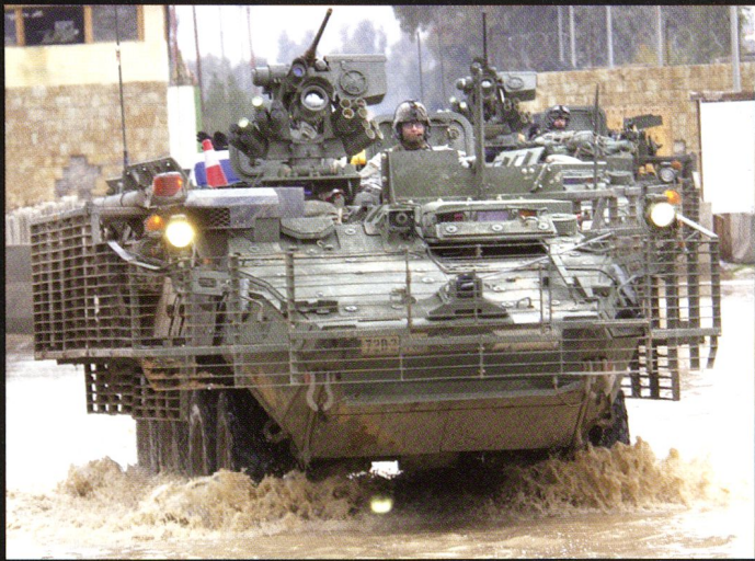
Le Stryker dispose d'une bonne mobilité sur sol dur, mais est vite limité en cas d'obstacle ou de surface meuble.