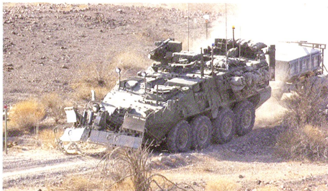
Ci-dessus : M1131 du 18th Engineer Company, 3 rd Brigade, 2 nd Infantry Division en Irak. L'engin peut être équipé de lames et de rouleaux anti-mines, ainsi que du système explosif MICLIC.

En outre, il est prévu que deux autres unités soient converties en SBCT en 2011 et 2012 respectivement :