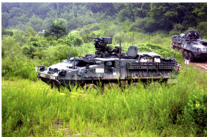
M1126 à l'entraînement. 5 th Brigade, 2 nd Infantry Division.