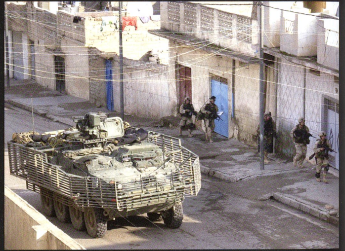
Ci-dessus et ci-dessous : débarquement et assaut d'une maison par des soldats de la 3 rd SBCT, 2 nd Infantry Division, en Irak. L'infanterie débarquée et les tourelles télé-opérées assurent la surveillance et la protection vers le haut.