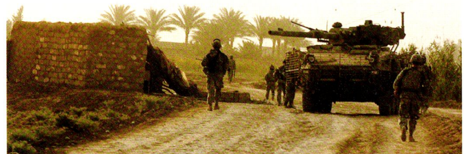
Les débuts opérationnels du MGS ont été en 2007, au sein de la 4 th SBCT, 2 nd ID.