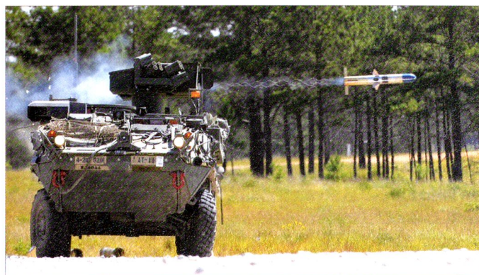
Le M1134 et sa tourelle TOW permettent une défense minimale contre des forces conventionnelles.

La base du concept de SBCT est la capacité de déployer une brigade par avion n'importe où dans le monde dans les 96 heures, une division en 120 heures et cinq divisions en 30 jours, tout en pouvant débuter les opérations dès l'arrivée. 2 Une brigade représente le déplacement de 7'800 tonnes et nécessite 288 chargements par C-17 Globemaster III . La brigade dispose d'une empreinte logistique réduite et peut donc se satisfaire d'une infrastructure austère.