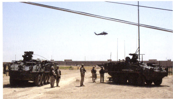
Echelon avancé de commandement (EAVC) de la 2 nd Infantry Division en Irak, équipé de M1130.