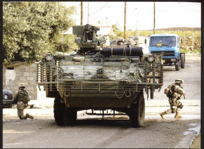
Le problème principal du Stryker en Irak est la largeur de ses blindages additionnels, qui empêchent le croisement dans la plupart des rues.