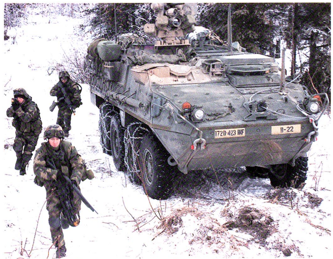
Exercice de la 172 nd Infantry Brigade (National Guard).