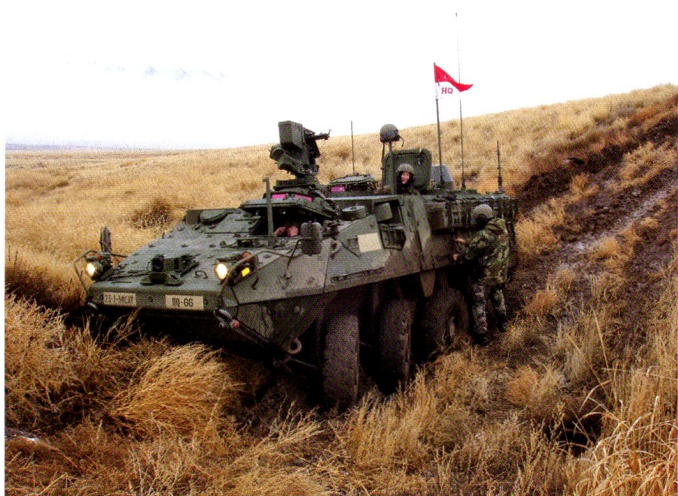
Véhicule du commandant du 1-14 CAV (RSTA), 3 rd Brigade, 2 nd Infantry Division, embourbé...