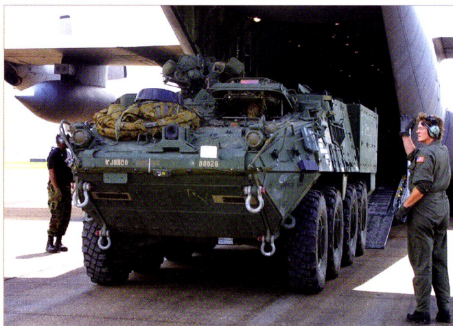
Stryker M1129 déchargé d'un C-130. La place disponible ne permet pas l'emport à la fois du véhicule, du matériel et de la troupe.

L'atout principal des unités Stryker est leur capacité à être déployées rapidement par les airs (ici, deux M1126 dans un C-17) : 96 heures pour une brigade.