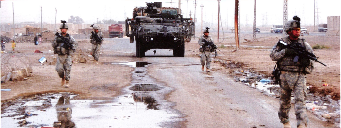
Progression d'une section de la 3 rd SBCT en Irak.

A la fin de 2005, avec 300 engins déployés en Irak depuis près de deux ans, des études ont déterminé la nécessité de remplacer ceux-ci par de nouveaux véhicules. Ces Stryker ont servi un an à la formation de nouvelles unités, puis ont été entièrement remis à neuf. Depuis 2006, une infrastructure de maintenance a été installée par General Dynamics Land Systems (GDLS) au Qatar. Chaque année, une centaine de véhicules y sont totalement démontés et remis à neuf, pour un coût annuel de 127 millions de dollars.