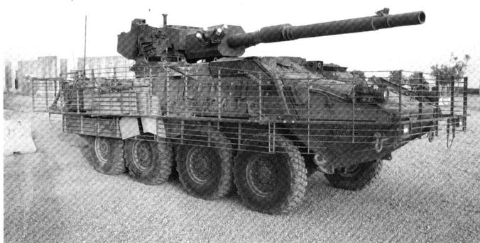
M1128 MGS, armé d'un canon de 105 mm. Il est protégé par des grilles anti-RPG.