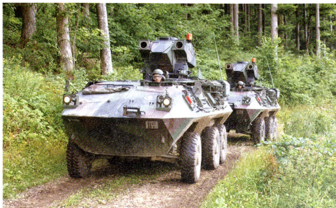
Chasseur de chars 90 ( TOW Piranha ).

troupes (6 soldats, 274 engins) armé d'une mitrailleuse. Le Husky est un engin de dépannage (27). Ces versions 6x6 pèsent 10,7 tonnes, disposent d'un moteur Detroit Diesel de 275 PS et emmènent un équipage de 3 hommes.