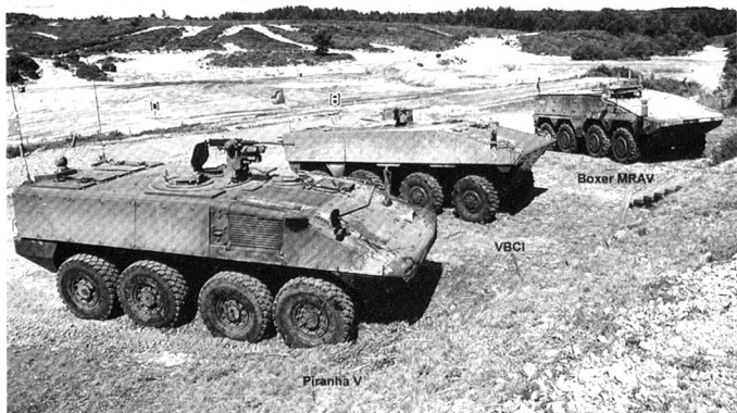
Les compétiteurs du programme britannique FRES. De gauche à droite : Piranha V, VBCI et Boxer .

Ci-dessous : l'armée suisse convertit une partie de ses Piranha 1 6x6. A gauche, un engin équipé d'une tourelle RWS Kongsberg. A droite, un engin reconfiguré en ambulance blindée.