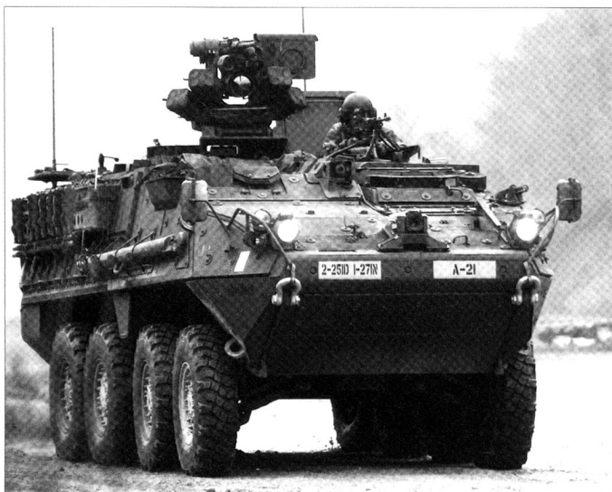
M1126 Stryker ICV de la 2 nd brigade, 25 th Infantry Division.