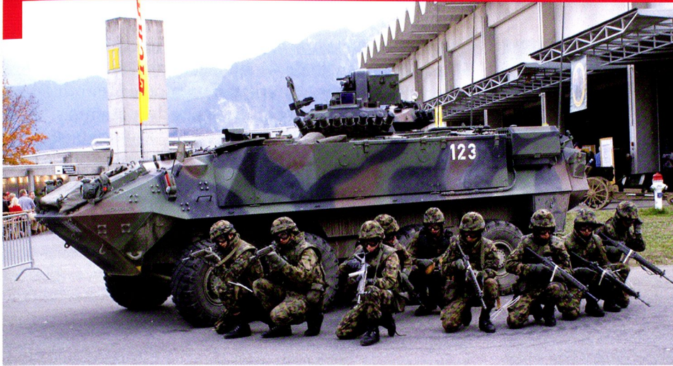
Journée des Forces Terrestres à Thoune, 2007 : Présentation d'un groupe de fusiliers débarqués et de son char de grenadiers à roues 93 ( Piranha II ).