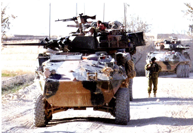
ASLAV - version australienne du LAV-25 ( Piranha I).