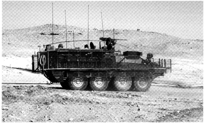
Le M1130 de commandement se distingue peu, extérieurement, des engins de combat.

En trente ans, le Piranha a pris du poids... D'un engin bon marché et amphibie, il est devenu un système complexe de 25 tonnes – ce qui représente une limite sur le plan technique. On considère en effet qu'un essieu peut soutenir un maximum de 2,5 tonnes, ce qui selon le système utilisé implique un plafond de 12 ou de 24 tonnes. La mobilité du Piranha est donc limitée de trois