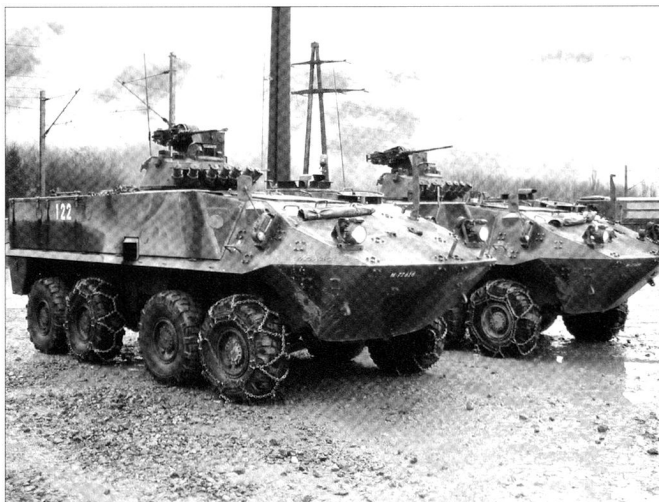
Chars de grenadiers à roues 93 (Suisse), sur base LAV-II.