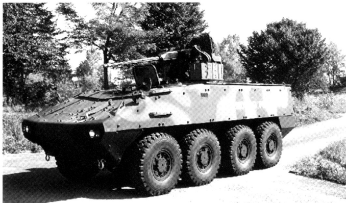
Le Piranha IV peut emporter des armes imposantes - à l'instar de la tourelle Elbit de 30 mm, proposée à la Pologne.