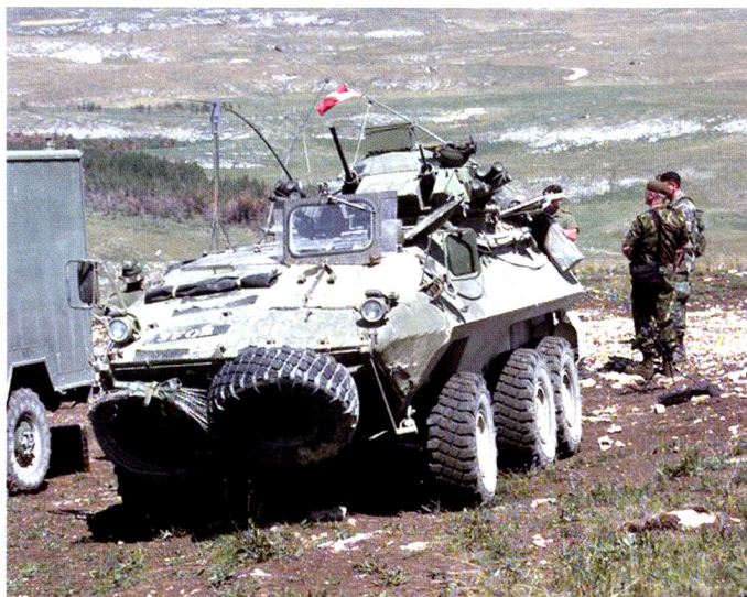
Grizzly canadien, armé de 2 mitrailleuses.