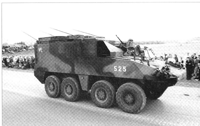
LAV-III de commandement de Grande unité (Suisse).