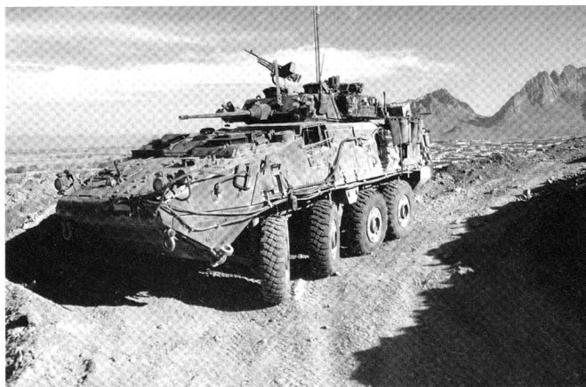
LAV-III Kodiak de l'armée canadienne en Afghanistan.