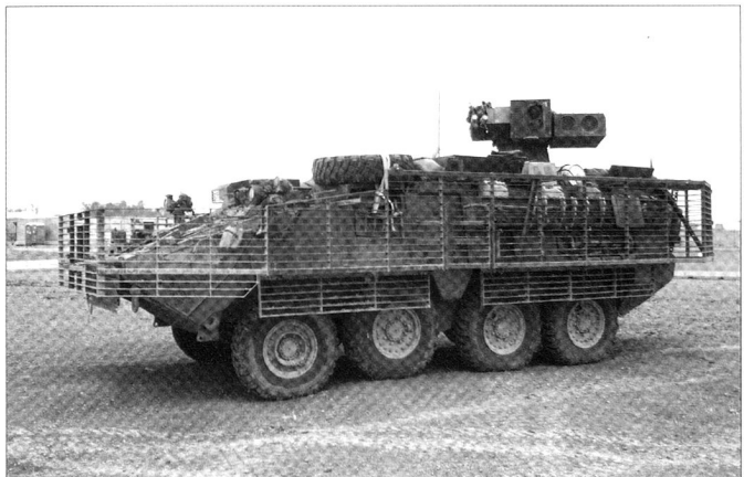
M1134 équipé d'une tourelle tandem TOW.