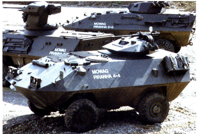
Le Mowag Piranha I d'origine, en versions 4x4, 6x6 et 8x8. Ces véhicules ont été loués pour le tournage de plusieurs films dans les années 1980. Ci-dessous : engin de la police allemande.

Le Piranha I répondait à une demande canadienne pour un Armoured Vehicle, General Purpose (AVGP). Il est entré en service en 1976 au Canada, en plusieurs versions 6x6. Le Cougar est un char léger équipé de la tourelle de 76 mm du char britannique Scorpion (100 exemplaires produits) ; il est utilisé dans des tâches de reconnaissance ou de maintien de la paix. Le Grizzly est un transport de