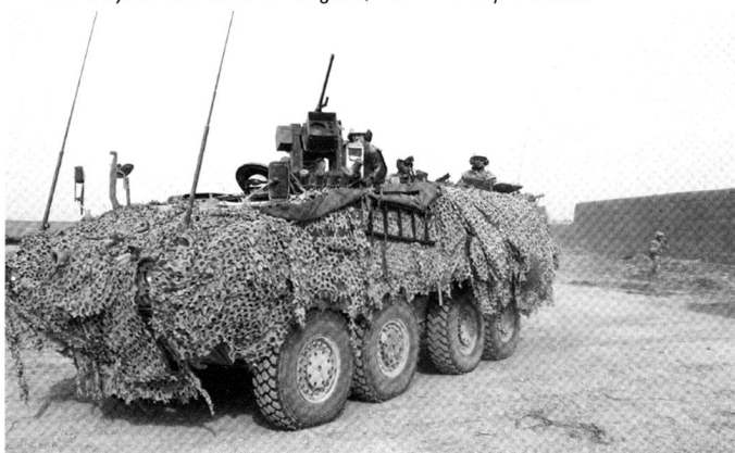
M1127 Stryker RV. On aperçoit les optiques déservis par le chef de véhicule.