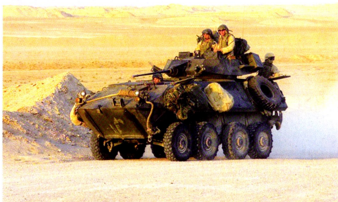
LAV-25 du corps des Marines américain.