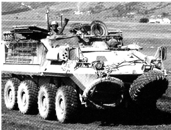
Bison 8x8 (LAV-II) de l'armée canadienne.