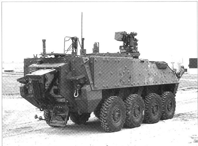
M1135 de reconnaissance/détection NBC.