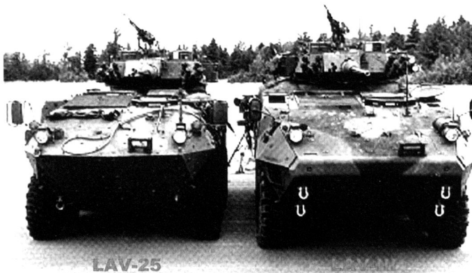
Le Piranha de II e et de III e génération côte à côte.