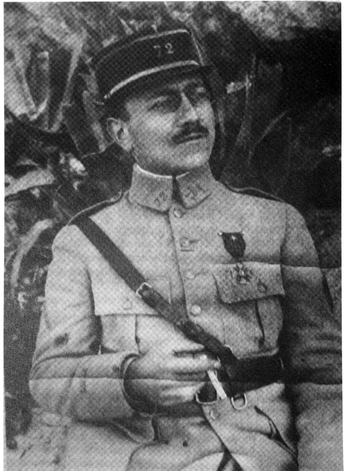
Le cap Marc Bloch, fusillé en 1944 pour faits de résistance

Quelles sont les causes de la défaite ? Pour Marc Bloch, la défaite est sans conteste imputable à « l'incapacité du commandement. » 5 La victoire allemande est avant tout une victoire intellectuelle de ceux qui ont su mener une guerre d'aujourd'hui, marquée par le sceau de la vitesse. 6 Pour notre historien, la préparation matérielle de la France n'était pas à la hauteur : les crédits de la France ayant été engloutis dans le béton de la ligne Maginot.