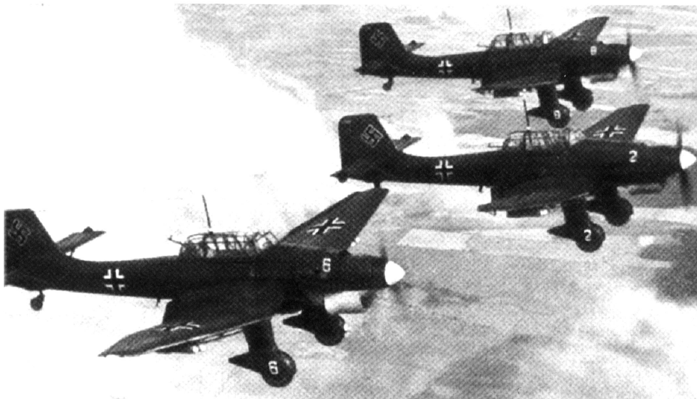
Le Ju 87 Stuka , appareil d'attaque au sol, terreur des soldats français.

infranchissable et impraticable pour une armée en campagne. Les Ardennes constituent depuis 2'000 ans le boulevard européen de l'invasion avec Sedan comme point de fixation. Pour notre auteur, c'est donc une erreur imputable au commandement militaire que de penser ce massif infranchissable. 14