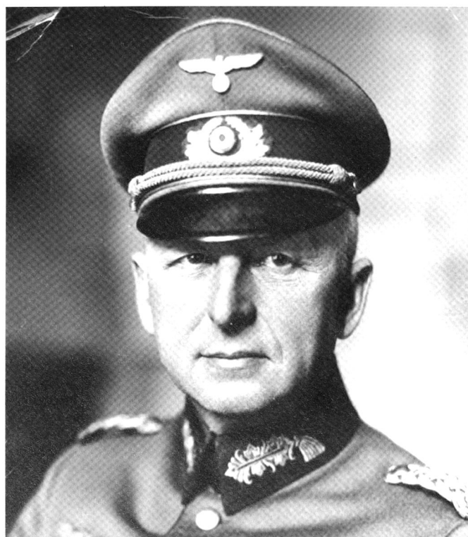
Le général von Manstein, auteur du Fall Gelb .