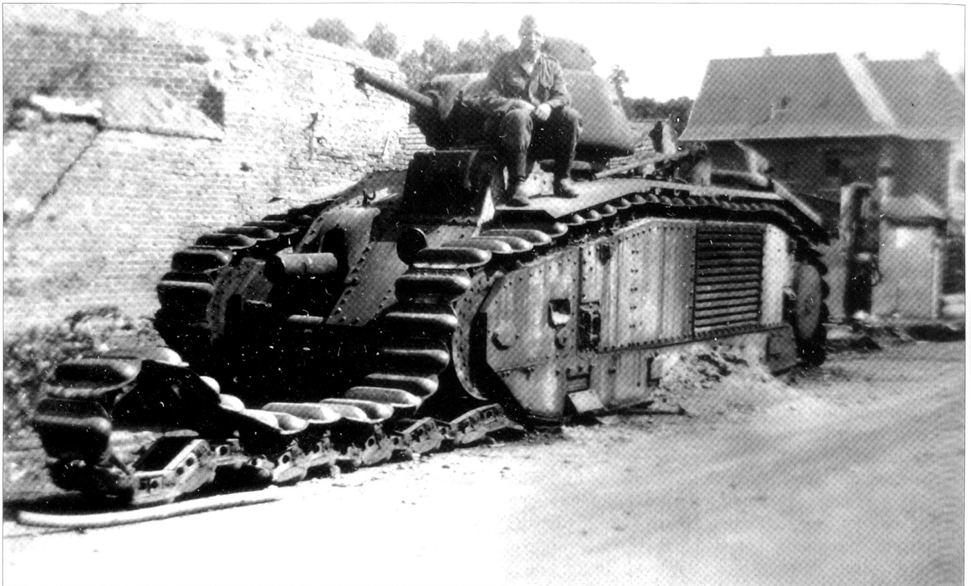
Le char B1, l'un des meilleurs de son époque, mais utilisé à mauvais escient par les forces françaises.

Ainsi, elle manquait de chars, d'avions, de tracteurs, de tout équipement nécessaire à arrêter une poussée mécanisée allemande. 7 Ce point-là est très intéressant, alors que nous savons maintenant que la France alignait 4'000 chars d'assaut face aux 2'500 chars allemands et que les 4'000 appareils de la Luftwaffe avaient maille à partir avec 3'200 avions portant la cocarde tricolore. Leur doctrine d'emploi ne correspondait tout simplement pas à une guerre moderne et ne permettait pas de créer un effort principal.