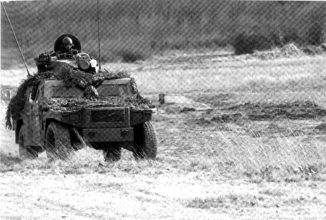
La capacité de l'armée à combattre existera-t-elle encore si les engagements subsidiaires deviennent prioritaires ?

n'auront pas été cernés, représentés, priorisés et expliqués les intérêts de la Suisse, ses forces et ses faiblesses, ses réserves et ses servitudes, ses alliances – au sens non militaire du terme – et ses oppositions, ses latitudes et ses dépendances. Cela ne signifie pas, bien entendu, que l'armée soit la réponse à tous les défis, à tous les dangers ; cela signifie que la politique de sécurité – dont l'institution militaire est par définition le bras armé – doit non seulement embrasser toutes les dimensions dont dépend l'avenir de notre pays et de sa population, mais également situer la voie à emprunter et les conditions pour ce faire. Sous peine de continuer d'avancer à l'aveuglette.