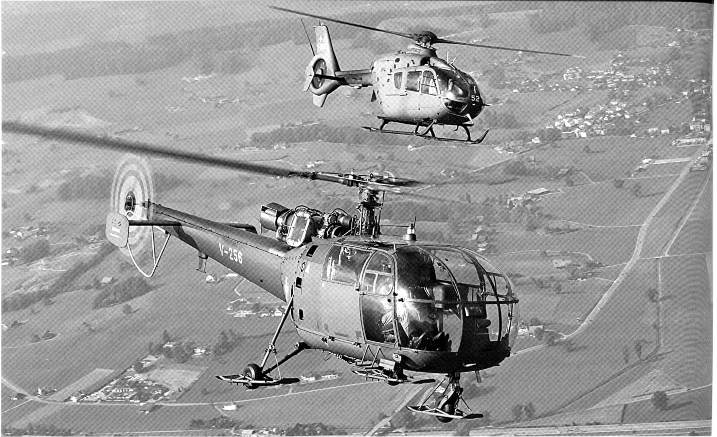
De l'Alouette III à l'EC-635, ou comment une armée moderne compense la baisse quantitative par la hausse qualitative.

renouvelé pour le pays. Les réductions budgétaires ne causent pas les problèmes de l'armée : elles les aggravent dans des proportions encore plus douloureuses.